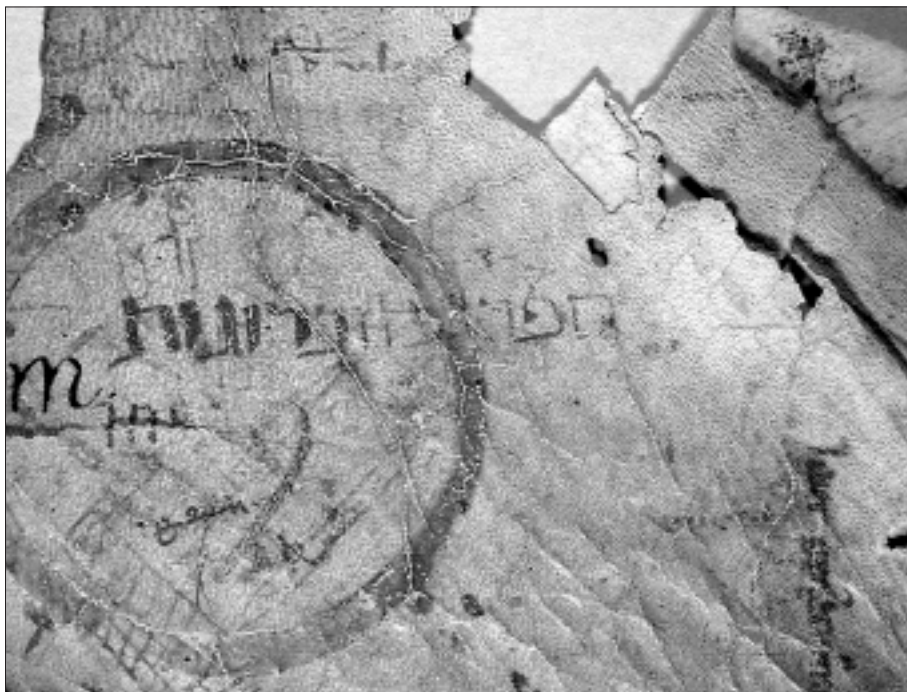
Coberta del Liber Judeorum 3 (1275-1280) amb la inscripció hebrea \text{t}^{\text{w}}\text{m}^{\text{r}}\text{k}^{\text{z}}\text{t} \text{ rps} («llibre de les memòries», amb el sentit de «registre»).