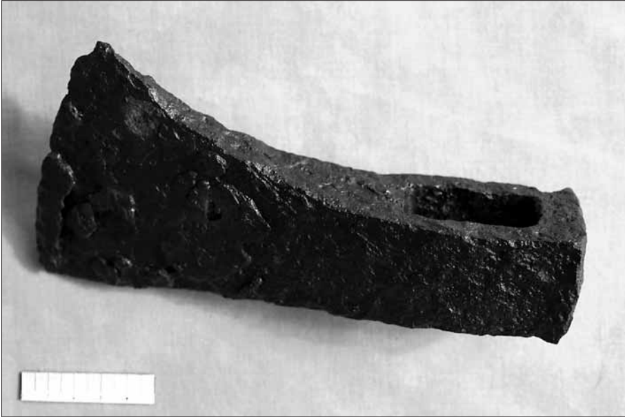
Destral medieval. Núm. Inventari: 01/158.

ibèrica, l'excavació medieval. També, com hem dit, des d'un punt de vista museogràfic es volia recalcar que, en arqueologia, qualsevol petit fragment, sigui de ceràmica o de metall, per posar un exemple, pot ser important i significatiu per a la interpretació històrica. Per això s'exposen peces significatives al costat de petits fragments, que permeten entendre el context global.