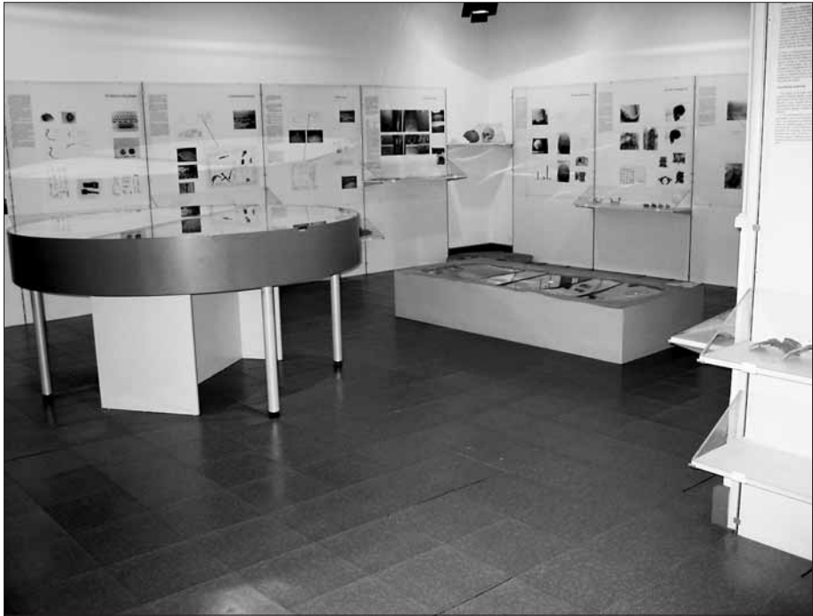
L'exposició permanent del Museu.

fons, en petits prestatges, s'exposen els objectes i les peces seleccionades, que poden fer entendre la vida a l'Esquerda en època ibèrica i medieval.