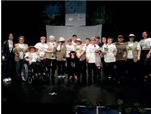
Imagen 1. La experiencia de ApS «Teatro de ayer y de hoy».

tabaco en la salud» y «Valorar el propio cuerpo». Ambos objetivos se enmarcan en el currículum de la Generalitat, en el ámbito de la educación física, dentro de la dimensión de hábitos saludables y la competencia «Mostrar hábitos saludables en la práctica de actividades físicas y en la vida cotidiana».