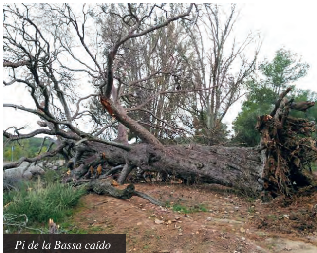
Pi de la Bassa caído