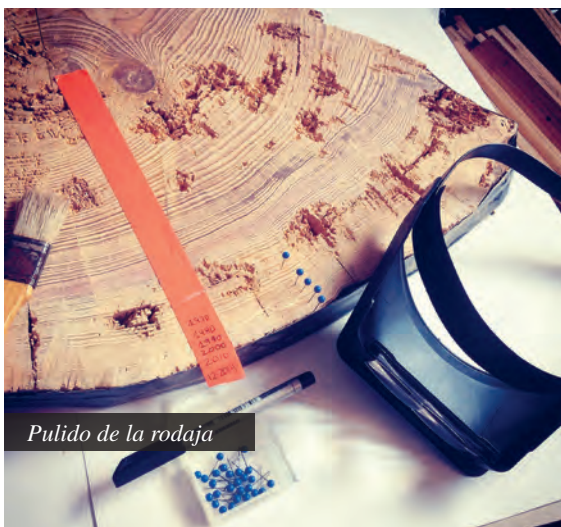
Pulido de la rodaja

La muestra fue trasladada a la Universidad de Barcelona, pulida con ayuda de los carpinteros y datada visualmente con la ayuda de unas gafas con lúpulos.