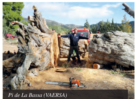
Pi de La Bassa (VAERSA)