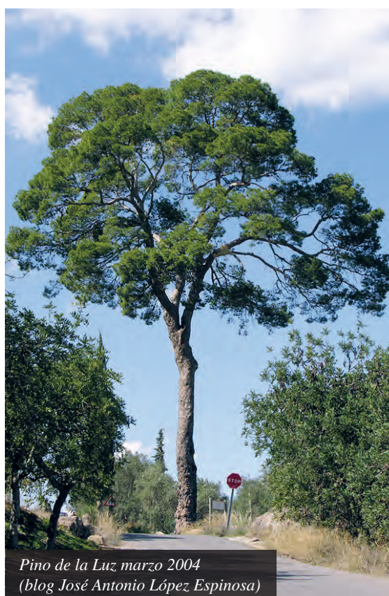
Pino de la Luz marzo 2004 (blog José Antonio López Espinosa)