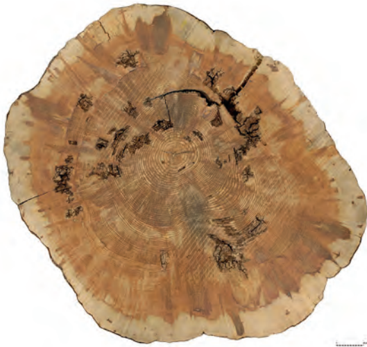
Pi de la Bassa

Con el fin de evitar el traslado de las rodajas hasta la Universidad, se realizaron fotografías de alta resolución de una de las rodajas y se envió la imagen al Laboratorio de Dendroecología de la Universidad de Barcelona, donde fue procesada y analizada.