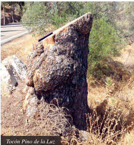
Tocón Pino de la Luz

Los árboles singulares como el Pi de la Bassa y el Pino de la Luz han sido un símbolo para los habitantes de ambos territorios. Formaban parte de las fiestas del lugar (la Romería de la Fuensanta , Murcia), acompañaban a los visitantes del eremitorio de la Luz y el monasterio de Porta Coeli, eran una parada más en las rutas de excursión y han formado parte de la vida de más de 10 generaciones de vecinos del lugar (en el caso del Pi de la Bassa). Estos dos árboles han sido tan importantes para la gente que para el Pi de la Bassa (o Pino Abuelo) existe el proyecto de plantar un nuevo árbol de otra especie con una placa conmemorativa y con el Pino de la Luz han querido dejar el tocón como recuerdo y símbolo del Árbol Monumental que allí se encontraba.