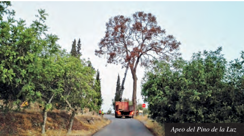
Apeo del Pino de la Luz

Las mediciones generales que disponemos del árbol son: que llegó a alcanzar una altura de 25,3 m. y una circunferencia de 3,70 m. (tomada a 1,50 m. de altura desde la base) (Sánchez Sánchez 2013, blog). Y la legislación de protección (Ley 14/2016, de 7 de noviembre, de Patrimonio Arbóreo Monumental de la Región de Murcia) lo describe con una altura de 22,3 m y una circunferencia de 3,30 m. Dicha ley sólo protege a los ejemplares de Pinus halepensis que superen un diámetro de más de 5,1 m a la altura de 1,30 m. Aunque sólo se encuentra 8 ejemplares en la región que cumplen con esas mediciones, pero ninguno es tan alto como el Pino de la Luz.