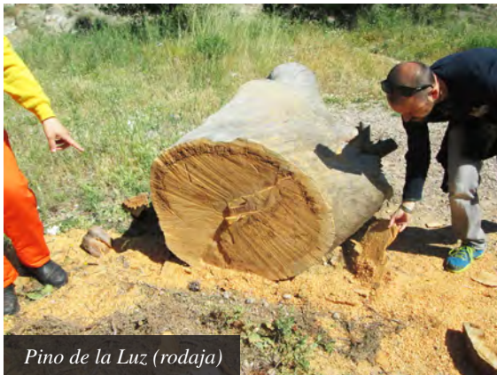
Pino de la Luz (rodaja)