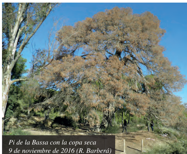
Pi de la Bassa con la copa seca 9 de noviembre de 2016 (R. Barberá)