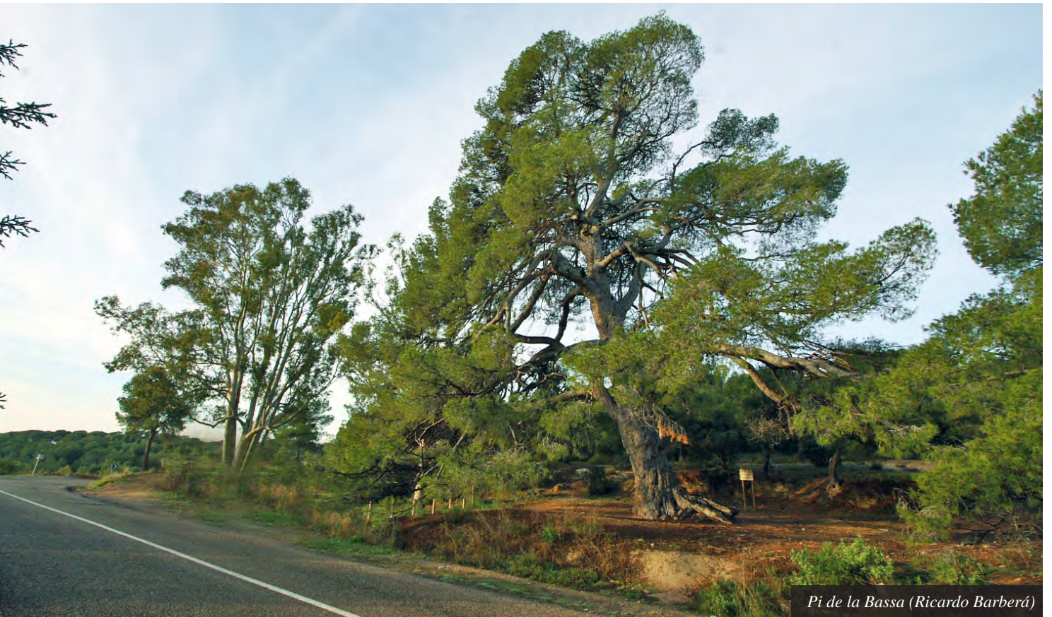
Pi de la Bassa (Ricardo Barberá)

En el estudio realizado, disponemos de dos árboles singulares: