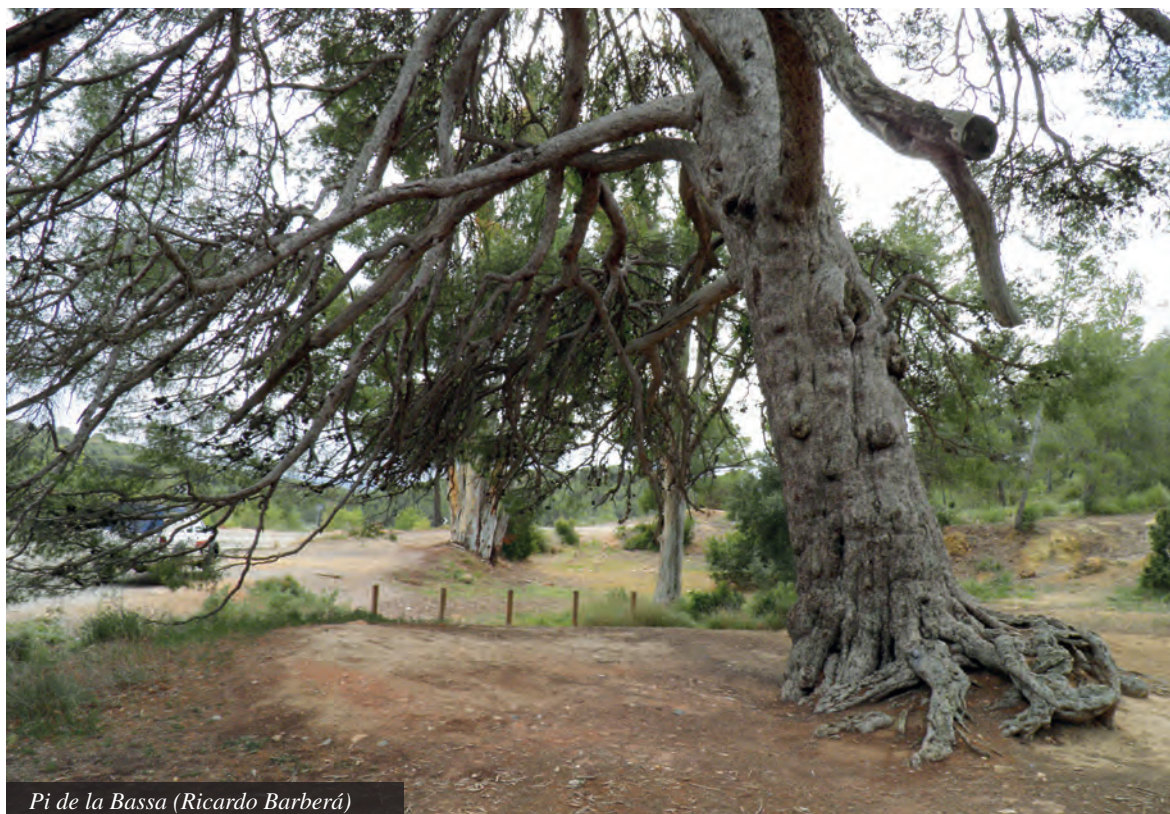
Pi de la Bassa (Ricardo Barberá)

visitantes y la falta de protección. Sucesión de los hechos previos a la muerte: