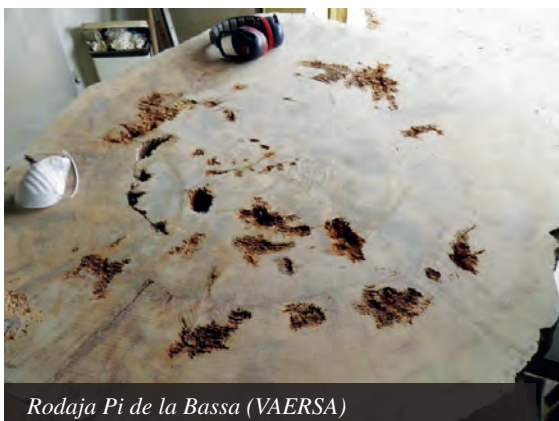
Rodaja Pi de la Bassa (VAERSA)

En el caso del Pi de la Bassa, la empresa Vaersa y el Centro para la Investigación y la Experimentación Forestal (CIEF) de la Generalitat Valenciana, se encargó de realizar los cortes transversales de las rodajas y las pulió.