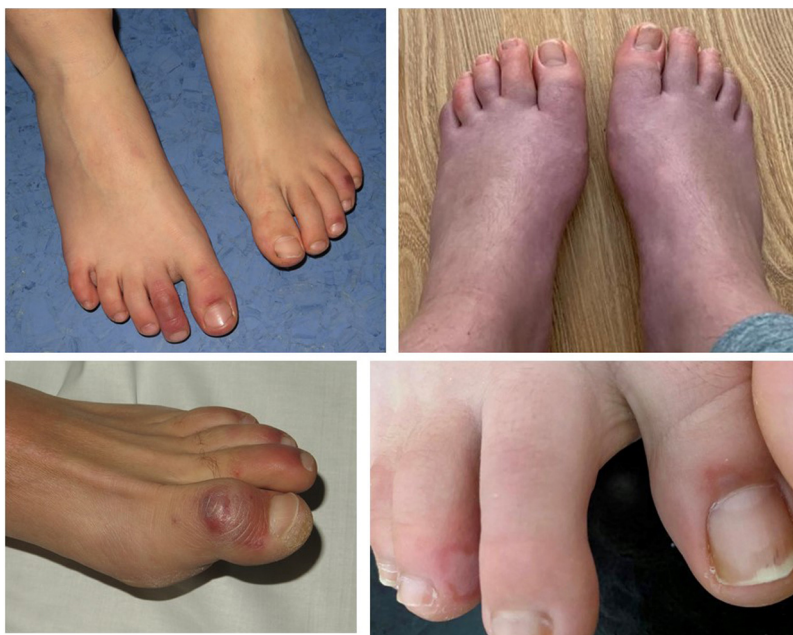
Figura 1 Lesiones pernióticas y edema en las manos y los pies.