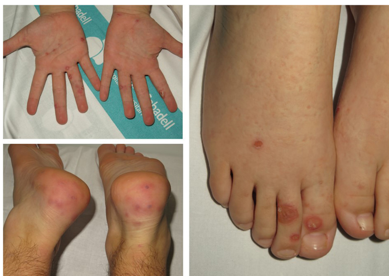
Figura 2 Lesiones redondeadas purpúricas predominando en las plantas o los talones.

19 durante el mes de febrero o principios de marzo, sin síntomas clínicos, lo que habría hecho que el virus no pueda ser detectado ya con la técnica de PCR. Una segunda explicación podría ser la baja sensibilidad de las pruebas rápidas de IgG/IgM, o la rápida desaparición de los anticuerpos circulantes, con niveles bajos que no llegan al umbral de detección de la técnica. Una tercera comprendería diferentes factores etiopatogénicos relacionados con el confinamiento, que no se han identificado hasta la fecha. Un estudio más detallado de más biopsias de piel, perfiles de autoinmunidad en suero y detección cuantitativa por PCR más refinada están en curso, para dilucidar la causa de estas lesiones dermatológicas.