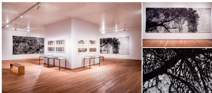
Figura 2. Jan Hendrix. The mythological landscapes of Yagul , Bonnefantenmuseum Maastricht, 2019. 2 B. Yagul Tree Crowns , 2C Detalles del tapiz. (© Manor Lux. © Copyright 2020 Factum Arte).

Otros ejemplos destacables son los proyectos desarrollados por Jan Hendrix, artista grabador que trasciende la estampa tradicional en soporte papel para expandirse en matrices recortadas que se convierten en estructuras arquitectónicas de grandes dimensiones y esculturas, o bien sus “estampas” tejidas con hilos de seda en sus tapices murales, como es el caso de la serie The mythological landscapes of Yagul (2018-2019), expuesta en Bonnefantenmuseum Maastrichts en noviembre del año 2019 (Fig.2).