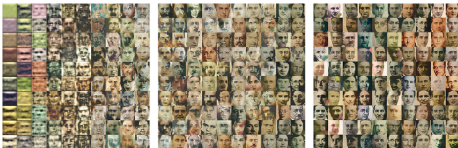
Figura 5. Joan Foncuberta y Pilar Rosado, Prosopagnosia , 2019. © COL·LECCIÓ BEEP).

libro también muestra la maravillosa secuencia de intentos fallidos que revisan pasos importantes de la historia del arte: expresionismo, cubismo, surrealismo, abstracción, etc.