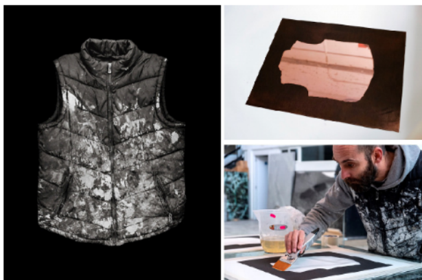
Figura 1. Mariana Cook, Factum Fetishes , ARCO 2019. 1A. Painter's Vest., 1B, 1C Detalles del proceso de realización de la estampa. (© Oak Taylor Smith © Copyright 2020 Factum Arte).

Fetishes (Fig.1) que la fotógrafa y artista americana Mariana Cook presentó en ARCO 2019, están realizadas con aguatinas sobre cobre que se imprimieron en papel Somerset Satin de 300 g/m2 con tinta de grabado Charbonnel, produciendo el negro intenso en cada impresión. La forma del objeto, que no había sido tocada por la placa entintada, se recubrió con gelatina transparente sobre la cual se registró con precisión una impresión digital de pigmento en la impresora de cama plana de Factum Arte. Se aplicó un barniz resistente a los rayos UV a los elementos impresos digitalmente para mejorar la diferencia entre el negro del fondo y la sutileza tonal de los ‘fetishes’, agregando una dimensión física a las imágenes.