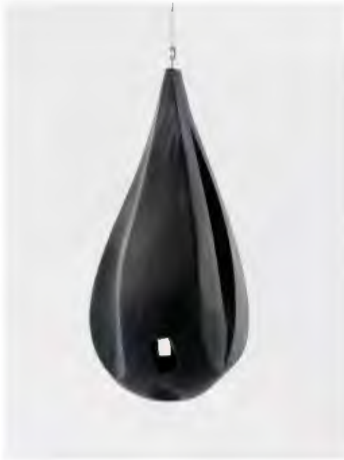
Bourgeois, L. (1986) Lair (Guarida) [escultura] Recuperado el 24 de mayo de 2020 de https://www.museopicassomalaga.org/exposiciones-temporales/louise-bourgeoishe-estado-en-el-infierno-y-he-vuelto