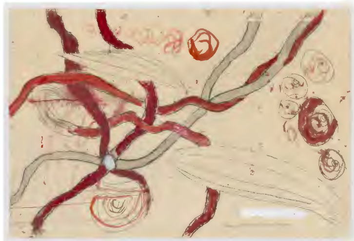
Bourgeois, L. (2008-09) À l'Infini Study (#2) [dibujo] Recuperado el 24 de mayo de 2020 de https://www.moma.org/collection/works/163545

20 Frémon, J. (2010) Mujer casa. Louise Bourgeois . Barcelona: Editorial Elba. p.22