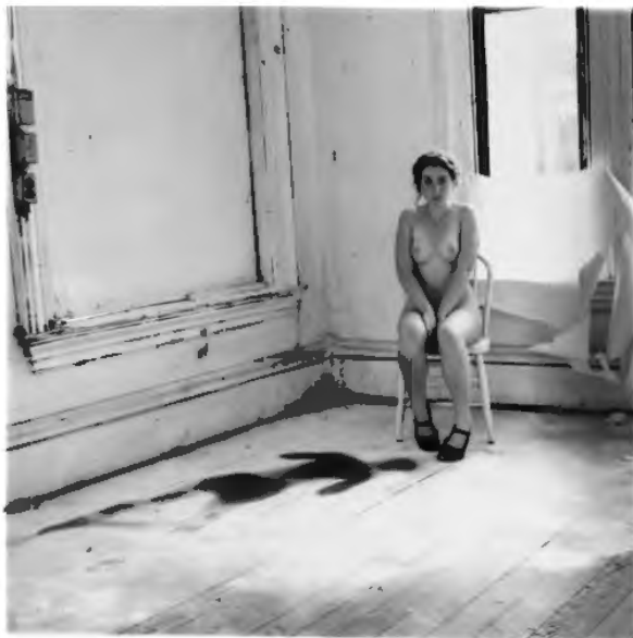
Woodman, F. (1976) Untitled , Providence, Rhode Island [fotografía]