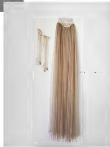
Artillo, E. (2019) El cuerpo incómodo [performance] Recuperado el 18 de mayo de 2020 de https://www.ernestoartillo.com/proyectos/el-cuerpo-incomodo

El punto de inicio es la experiencia personal ligada íntimamente con la necesidad de expresar, pensar y reflexionar sobre cuestiones como la cultura, la política, el género, la vulnerabilidad, la frustración... El cuerpo es la forma en la que nos percibimos y la manera en que nos perciben. La existencia se basa en aquí y en ahora, y es por eso que somos fruto de un momento social concreto pero que cada uno vive dentro de su individualidad, y yo me baso en la mía.