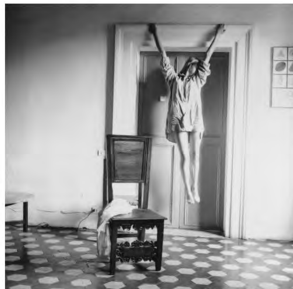
Woodman, F. (1977-78) Untitled , Rome, Italy [fotografía]