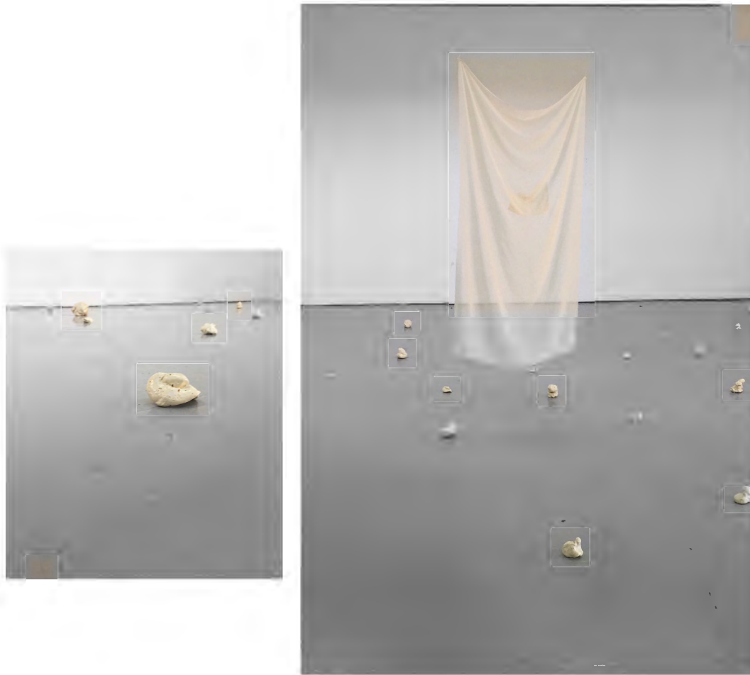
Imágenes de la instalación realizada en la sala Miró en diciembre de 2019.

(Formada por obras realizadas entre octubre y diciembre 2019)