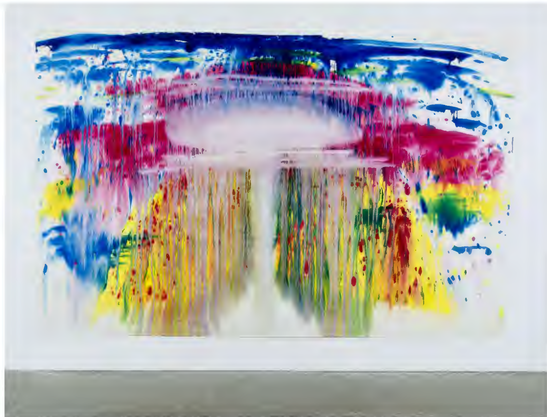
Cahn, M. (1991) Atombombe [pintura]

La intensidad entendida como un proceso de tensión es uno de los ejes centrales de mi producción. Una tensión que surge entre la obra y el espectador, entre la obra y yo, entre la obra y el entorno, entre la obra y el receptor. Al leer el capítulo titulado Identidades escrito por Jakub Momro del catálogo: Miriam Cahn, Todo es igualmente importante , me di cuenta del significado real de este término, y como este tenía una relación directa con mi obra. En este se entiende la intensidad como forma de mostrar nuestra contemporaneidad: “Contrastar fuerza con intensidad permite narrar la historia de nuestra modernidad. [...] La intensidad es fundamentalmente diferente a la fuerza, ya que persiste como efecto de la variedad de tensiones que surgen entre las imágenes y las figuras, el accidente y la intención, la visión y el objeto material que encarna la visión.” 15 El entender la intensidad como una tensión en la que se expone desde la individualidad el momento vivido en forma de obra, pero esta tensión sigue hasta el público y más allá.