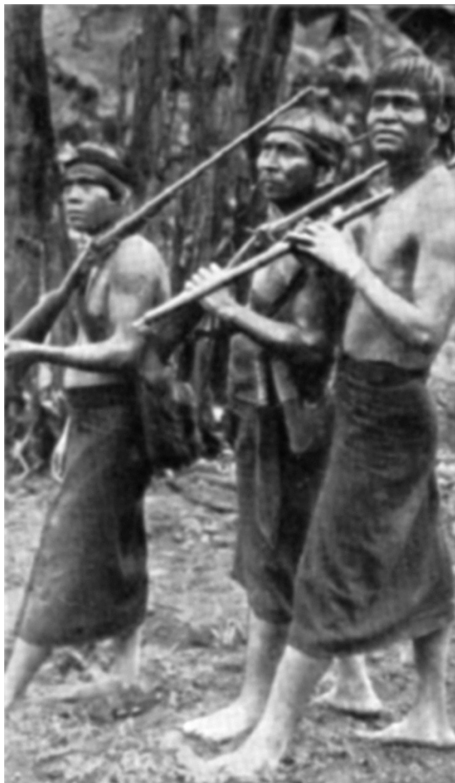
FIGURA 5 Jíbaros de caza