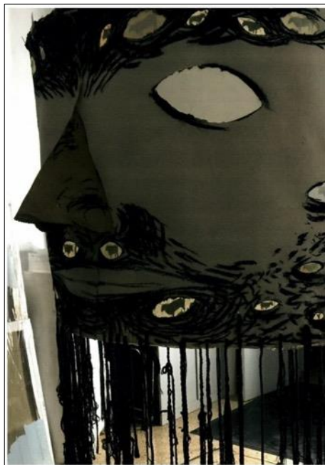
Fig. 4. Argos, el vigilant que no dorm. TransformACCIONS.

Com que el temps disponible no permet resseguir tot el llibre primer d'Ovidi, l'artista ha fet una tria. El caos inicial va seguit d'un text sobre el diluvi i la repoblació amb humans a partir de Deucalió i Pirra. Després, Pitó, el llorer (l'episodi de Dafne i Apol·lo), Argos i el mite de Pan i Siringa (fig. 4 i 5). Això li permet fer una crítica dels models que presenta la literatura antiga. Les històries de Dafne empaitada per Apol·lo, d'Io vigilada per Argos o de Siringa encalçada per Pan li permeten preguntar-se sobre els models que imposa la tradició literària i introduir-hi una perspectiva de gènere. La seducció dels déus, per ben explicada i poètica que sigui, no deixa de ser una imposició o una obligació; per tant, podem mirar la poesia des d'un altre angle. 15 Pan diu, en el text ovidià adaptat, "nosaltres mantindrem sempre aquesta conversa", perquè la noia ha estat transformada en flauta que el déu fa sonar. Vol dir això que aquest estar junts per sempre és per obligació? I quina idea d'estar junts és el fet que un bufi i l'altra soni per força? Aquesta és precisament la pregunta que es fa l'artista al llarg de l'obra i posa en evidència la desigualtat d'aquests models de seducció divina i la situació de víctima de la dona assetjada.