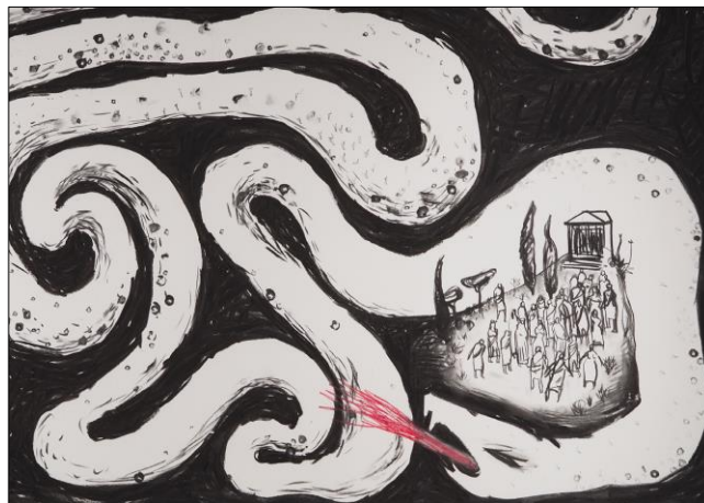
Fig. 5. Pitó. TransformACCIONS.

Per a Joma, aquesta és la lectura del final de l'espectacle: les històries d'Ovidi, en el fons, són assetjaments. Cada dia hom llegeix al diari històries semblants, perquè formen part del llenguatge des de sempre. L'objectiu de l'espectacle és preguntar-se per què hom es pot sentir fascinat per la figura i la música de Pan i no preguntar-se per l'origen de la flauta de Pan, o sigui, aquesta Siringa transformada a desgrat seu en instrument musical. Ell mateix explica 16 que una solució possible seria una mena de correcció política que evités el conflicte, o bé oblidar els textos, directament. Una altra solució –la que ell adopta– és pensar que aquests textos estan a l'origen de la nostra cultura, i fer-ne una lectura en clau de gènere. De cap manera no s'ha de renunciar a aquests textos, que són d'una bellesa poètica incomparable, però sí que cal manifestar la tensió que provoquen i reflexionar sobre aquesta tensió. No és el primer que reflexiona sobre el gènere en els mites clàssics i de fet hi ha d'altres iniciatives, acadèmiques i literàries, que han qüestionat la mitologia tal com l'hem rebuda, perquè hi ha tota una tendència a qüestionar les dades de la tradició històrica i artística des de la perspectiva de gènere, però és interessant veure que Joma, des de la creació, no rebutja el text antic, sinó que el reivindica tant per crear art com per crear pensament crític.