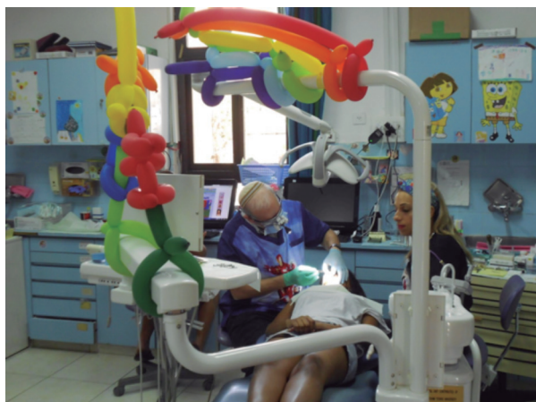
Fig. 3. Odontólogo voluntario de Estados Unidos.

de seis sillones dentales equipados con tecnología avanzada, radiografía digital y materiales dentales de la mejor calidad donados por compañías odontológicas internacionalmente reconocidas (1-3).