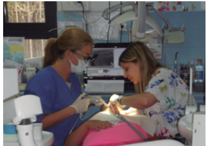
Fig. 1. Odontóloga voluntaria de los Estados Unidos con su asistente de Jerusalén.

DVI recibe hasta 10 dentistas árabes israelíes locales por año con el fin de mejorar sus habilidades en odontología, ampliar su gama de tratamientos y obtener acceso a programas de especialización altamente competitivos, lo que les permite poder avanzar profesional y económicamente en la sociedad israelí (1). Debido a la política de DVI de mantener a un director de clínica que enseña activamente en los programas de especialización de la Universidad de Hadassah, DVI ha