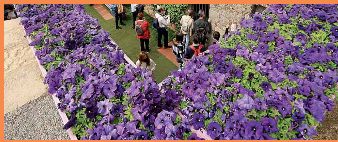
Edició d'enguany del Girona Temps de Flors ➔ MANEL LLADÓ