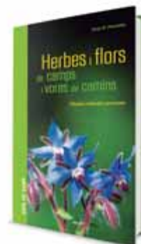
HERBES I FLORS DE CAMPS I VORES DE CAMINS

Per complementar-ho, i per si volem gaudir de la bellesa de les flors al nostre jardí, també us suggereixo Guia botànica per al teu jardí. L'art i la ciència de la jardineria per a tots els públics , una guia pràctica per ajudar els amants del jardí a entendre com creixen les plantes, quins factors les afecten i com es poden obtenir els resultats més vistosos. Perquè, com diuen explícitament els autors d'un d'aquests llibres al pròleg, "sense flors el nostre entorn seria inimaginable".