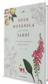
GUIA BOTÀNICA PER AL TEU JARDÍ

Autor: Josep M. Panareda Editorial: Brau