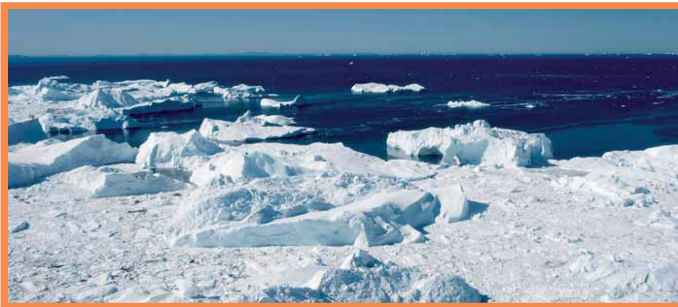
Fiord de gel a l'oest de Groenlàndia, afectat pel canvi climàtic