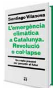
L'EMERGÈNCIA CLIMÀTICA A CATALUNYA. Autor: Santiago Vilanova Editorial: Edicions 62