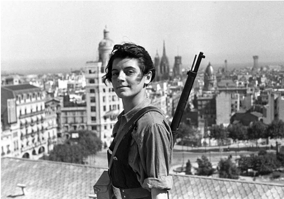
Foto de la Miliciana Marina Ginestà, la noia del fusell. Foto: Justa Revolta Extreta: Ab Origine. Article: Les dones a la Guerra Civil: al front o a la rereguarda? (II) http://www.aboriginemag.com/les-dones-a-la-guerra-civil-al-front-o-a-la-rereguarda-ii/