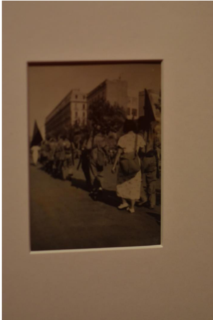
Dones acompanyant els seus homes abans d'anar al front. Exposició :La Guerra Infinita.