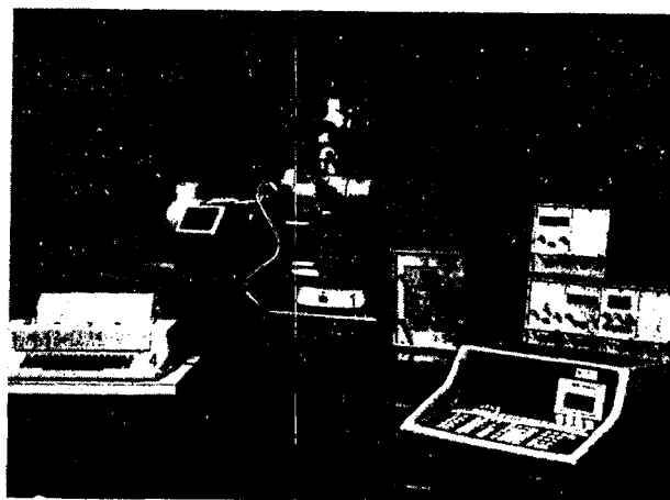
FIG. 2. — Sistema fotométrico-automático. Explicación en el texto.

Una vez finalizado todo el proceso de cálculo los datos son almacenados en memoria interna y transmitidos a la inscriptora-plotter que se encarga de dibujar las curvas de dispersión de todas las constantes.