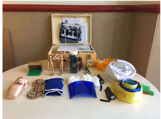
Figura 7. Interior y materiales de la "Maleta Dan, Dan, Dansa" del Mercat de les Flors.

Para el mundo de la danza se seleccionó otra maleta que cuenta con una intensa distribución y aceptación: la del Mercat dels Flors denominada "Dan, Dan, Dansa", que incluye materiales e ideas Vehiculadas a través de distintas metodologías para trabajar la danza en la escuela. En la actualidad, dicha maleta también cuenta con una versión online.