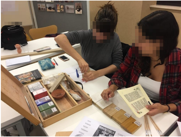
Figura 4. Dos de las participantes manipulando el material de la maleta "Pintores góticos" de Schola Didáctica Activa.

En cuanto al cine, el séptimo arte quedó representado con la maleta "7 de Cinema" proporcionada por la Filmoteca de Catalunya. Fue diseñada para ESO y Bachillerato, y contiene atrezzo relacionado con los diferentes géneros, cintas, objetos empleados en los rodajes, etc., así como una guía didáctica con propuestas configuradas a través de distintos itinerarios.