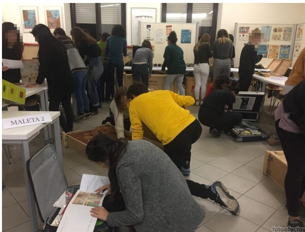
Figura 2 Toma de contacto e inicio del análisis por parte de los estudiantes.

analizar el poder didáctico de estos objetos y su aplicabilidad en el aula. Para tal fin, se les preguntó su opinión sobre el contenedor, los ámbitos de pertenencia, los recursos -y su usabilidad- y el contenido -implicando tanto de la eficacia de los contenidos implícitos en los aprendizajes invisibles como la calidad de aquellos especificados en la guía didáctica. A continuación, se reseña brevemente las instituciones a las que se recurrió y las maletas que se analizaron.