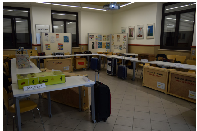
Figura 1. Imagen de la muestra de las maletas seleccionadas.

De este modo, partiendo de premisas y análisis previos se diseñó y puso en práctica una experiencia en la que se implementa la competencia crítica. Evaluaron el potencial didáctico de 14 maletas pedagógicas y se les pidió opinión sobre sus fortalezas y debilidades. Como trabajo previo, se contactó con las distintas instituciones que las distribuían y se gestionó el envío de las maletas, que fueron seleccionadas aplicando criterios de accesibilidad, difusión, y facilidad a la hora de solicitar su uso dentro de las redes culturales de la Comunidad Autónoma de Cataluña. En suma, se escogieron tanto maletas de temáticas afines al Máster, como también de otras temáticas relativas a otro tipo de contenido, que han servido también para identificar y valorar las distintas metodologías existentes. No obstante, en la experiencia, se ha primado la elección de maletas que ofrecen propuestas que trabajan el lenguaje artístico sobre otras que versan sobre otras disciplinas. Las maletas finalmente seleccionadas pertenecen al ámbito del arte contemporáneo, la danza, el cine, los museos, la historia, la literatura y la comunicación.