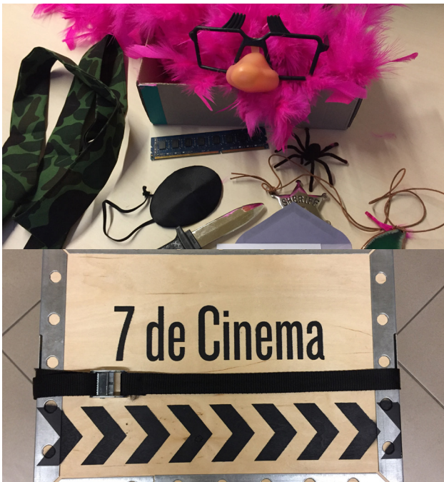
Figuras 5 y 6. Exterior y algunos de los materiales interiores de la "Maleta 7 de cinema" de la Filmoteca de Catalunya.

En cuanto al cine, el séptimo arte quedó representado con la maleta "7 de Cinema" proporcionada por la Filmoteca de Catalunya. Fue diseñada para ESO y Bachillerato, y contiene atrezzo relacionado con los diferentes géneros, cintas, objetos empleados en los rodajes, etc., así como una guía didáctica con propuestas configuradas a través de distintos itinerarios.