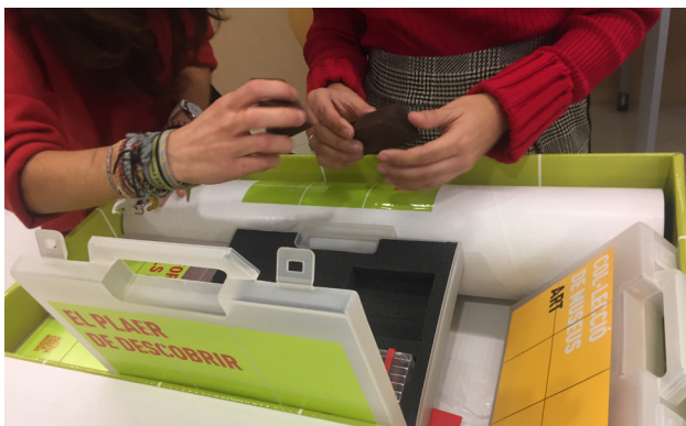
Figura 3. Detalle del material contenido en la “Maleta Cívica” del Ayuntamiento de Barcelona.

En cuanto a la temática del arte y la historia - varia -, se contactaron con diversas instituciones cívicas y museísticas. El Instituto de Cultura del Ayuntamiento de Barcelona cedió la “Maleta cívica”, que contiene materiales relacionados con 13 museos de la ciudad del ámbito del arte, las artes visuales, la ciencia y la historia, y en la que se ofrecen sugerencias sobre cómo dinamizar las actividades que se pueden realizar en el aula.