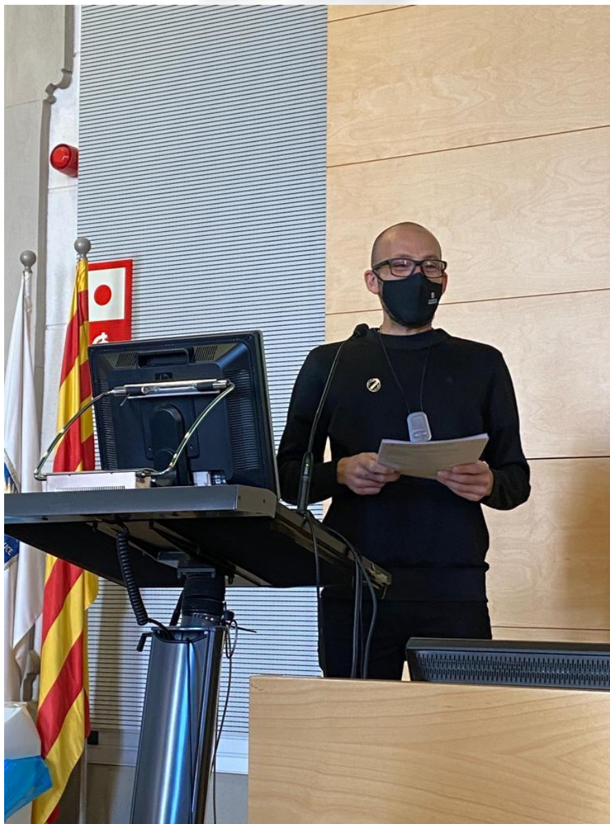
Aprofitant l'espai. Nou sistema d'emmagatzematge al CRAI Dipòsit de Cervera | Jordi Balagué. CRAI Dipòsit de Cervera. CRAI Unitat de Gestió de la Col·lecció