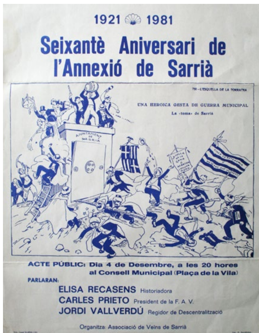
Cartell commemoratiu del 60è aniversari de l'annexió de Sarrià.