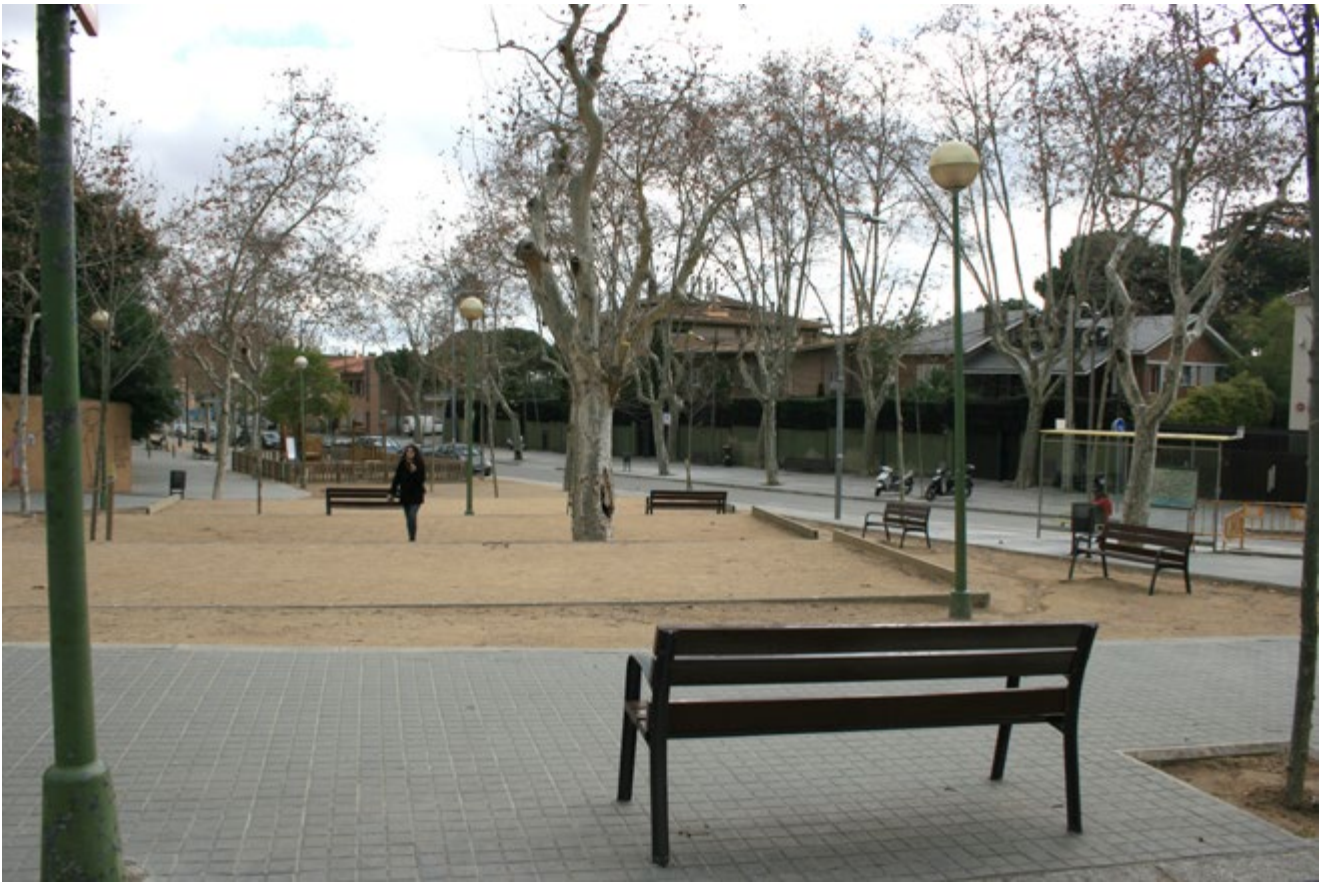
Imatge del Desert de Sarrià (2013).

noves compartimentacions polítiques —els districtes— i una oferta de festes i efectes especials per a l'exaltació d'una mena de nou patriotisme urbà amb capital a la plaça Santa Jaume.