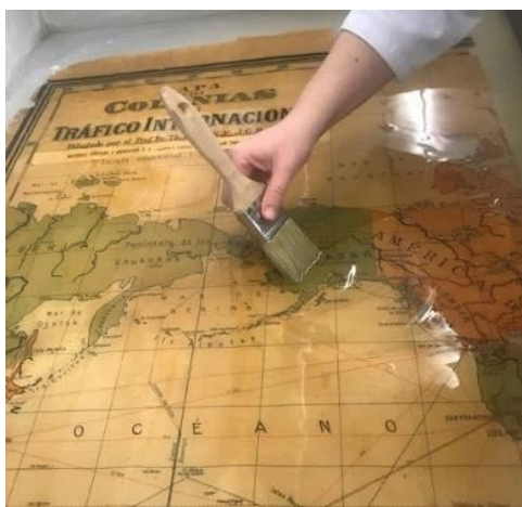
Neteja humida del document

Primer vam fer-los una neteja en sec amb aspirador i gomes de diverses dureses, i després vam realitzar la neteja humida en un primer bany d'alcohol i un segon amb aigua filtrada fins que van quedar ben nets i sense restes de goma laca. Va ser necessari insistir mecànicament sobre la superfície del vernís amb pinzell per poder-lo retirar.