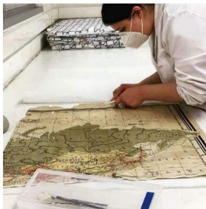
Consolidació del paper

Com que el paper estava molt trencat en algunes parts, es va fer una feina prèvia de consolidació del mapa encolant els petits fragments per la part posterior amb paper japonès, reconstruint aquestes parts del mapa per facilitar el pas següent de restauració.