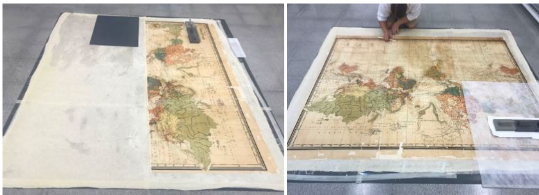
Encolat dels fragments sobre una tela

Una vegada vam tenir les 6 peces reintegrades i laminades vam procedir a entelar-les en una peça única de tela de cotó, tenyida prèviament, per tal de donar-li consistència i unir tots els fragments en una sola unitat. Es va encolar tot sobre una superfície i es va deixar assecar per tensió.