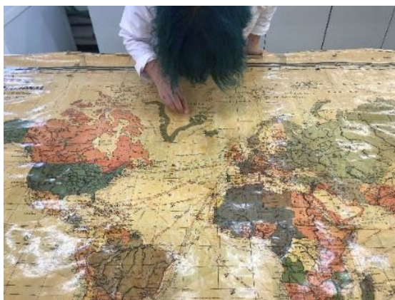
Proves de solubilitat del vernís de protecció

Inicialment se li van realitzar tota una sèrie de proves per poder retirar la goma laca sense perjudicar el paper original ni les diferents tintes de la superfície.