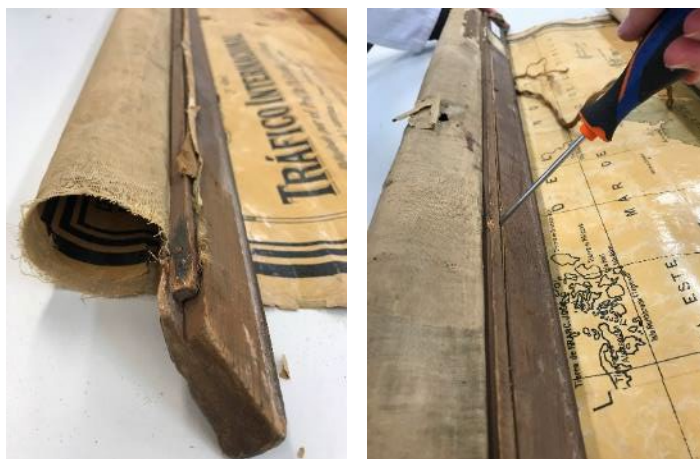
Fusta de la part superior del mapa

Una vegada realitzades totes les proves corresponents al paper, vam procedir a desencolar-lo de la tela. L'obra estava formada per 6 peces de paper encolades entre si, una al costat de l'altra formant el mapa, i després tot encolat a un tros gran de tela. Vam anar desencolant cadascun dels fragments per poder-ne fer el tractament de manera separada, ja que el mapa sencer era massa gran per poder-lo tractar.