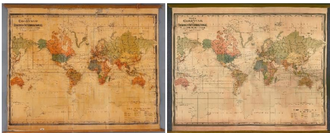
Mapa abans i després de la restauració