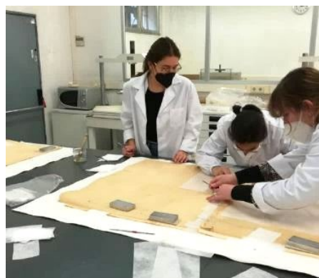
Separació dels fragments que composaven el mapa

Primer vam fer-los una neteja en sec amb aspirador i gomes de diverses dureses, i després vam realitzar la neteja humida en un primer bany d'alcohol i un segon amb aigua filtrada fins que van quedar ben nets i sense restes de goma laca. Va ser necessari insistir mecànicament sobre la superfície del vernís amb pinzell per poder-lo retirar.