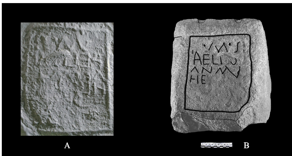
Fig. 3A: Calco con papel secante sobre el campo epigráfico (J. Toribio); 3B: Calco con la lectura propuesta (R. de Balbín-Bueno).

La lectura del epígrafe presenta problemas debido al desgaste del texto; esto puede deberse, en primer lugar, a la mala calidad del trazo original de las letras, a lo que se suma el mal estado de conservación, asociado también a la erosión del material. Para establecerla, hubo que realizar un estudio fotográfico completo. Se ejecutó, en primer lugar, una documentación fotogramétrica de la pieza, para poder obtener una reconstrucción 3D de la misma. Esta se usó como base de manipulación, mediante diferentes programas de tratamiento de imagen (DStretch, Photoshop) cuyo resultado fue la elaboración de un calco (fig. 3B). Contamos también con un calco directo del anverso (fig. 3A), con la idea de obtener todos los medios posibles sobre los que realizar la transcripción y lectura. La obtención de las mismas conclusiones por ambas vías de estudio creemos afianza nuestra propuesta de lectura.