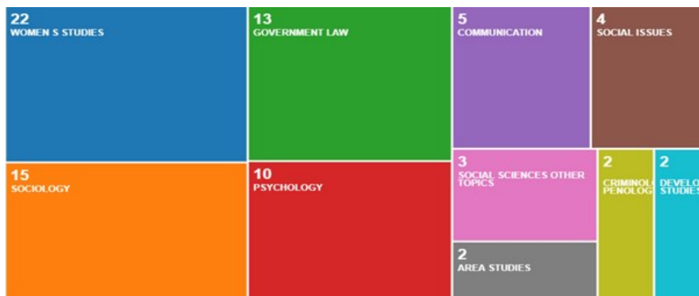
Figura 2. Áreas temáticas de los artículos seleccionados en la base de datos Web of Science.

Las principales áreas de investigación de los trabajos seleccionados fueron: Women Studies, seguida de Sociology, Government Law y Psychology (véase figura 1). El artículo más antiguo que arrojó la búsqueda en las combinaciones de palabras mencionadas se publicó en 1994 y el más reciente en el mismo año de la búsqueda, 2020 (véase figura 2).