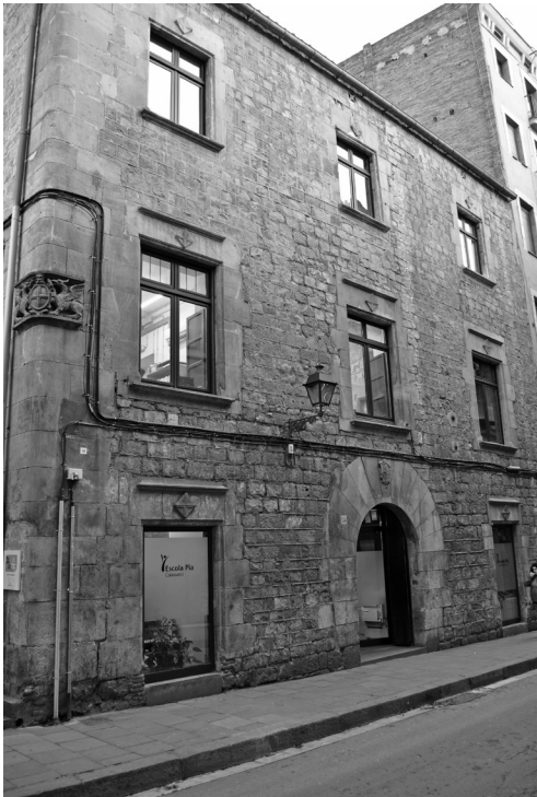
Casa del portal de Sant Antoni, Barcelona, c. 1573-1582.