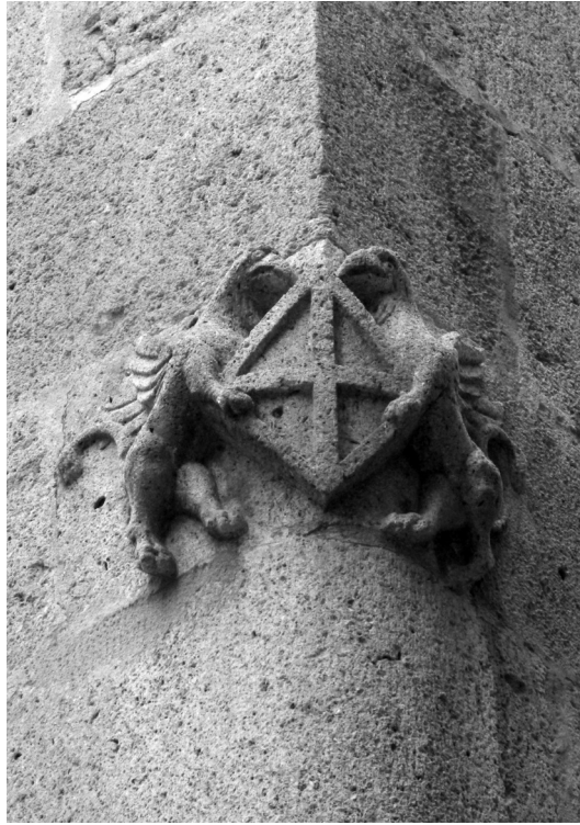
Escut del General a la façana de la casa de Tarragona.