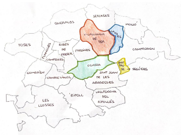
Figura 2. Mapa de la ZER de la Vall del Ter.

Aquesta ZER, com es pot observar al seu blog XTEC (2022), està formada per quatre escoles situades a la Vall de Camprodon i repartides en diferents municipis: l' Escola Les Moreres de Llanars, l' Escola l'Esquirol d'Ogassa, l' Escola Els Pinets de Sant Pau de Segúries i, finalment, l' Escola La Daina de Vilallonga de Ter. En el mapa següent referent a la comarca del Ripollès, es poden veure els diferents municipis on es troben les escoles que pertanyen a la ZER de la Vall del Ter.