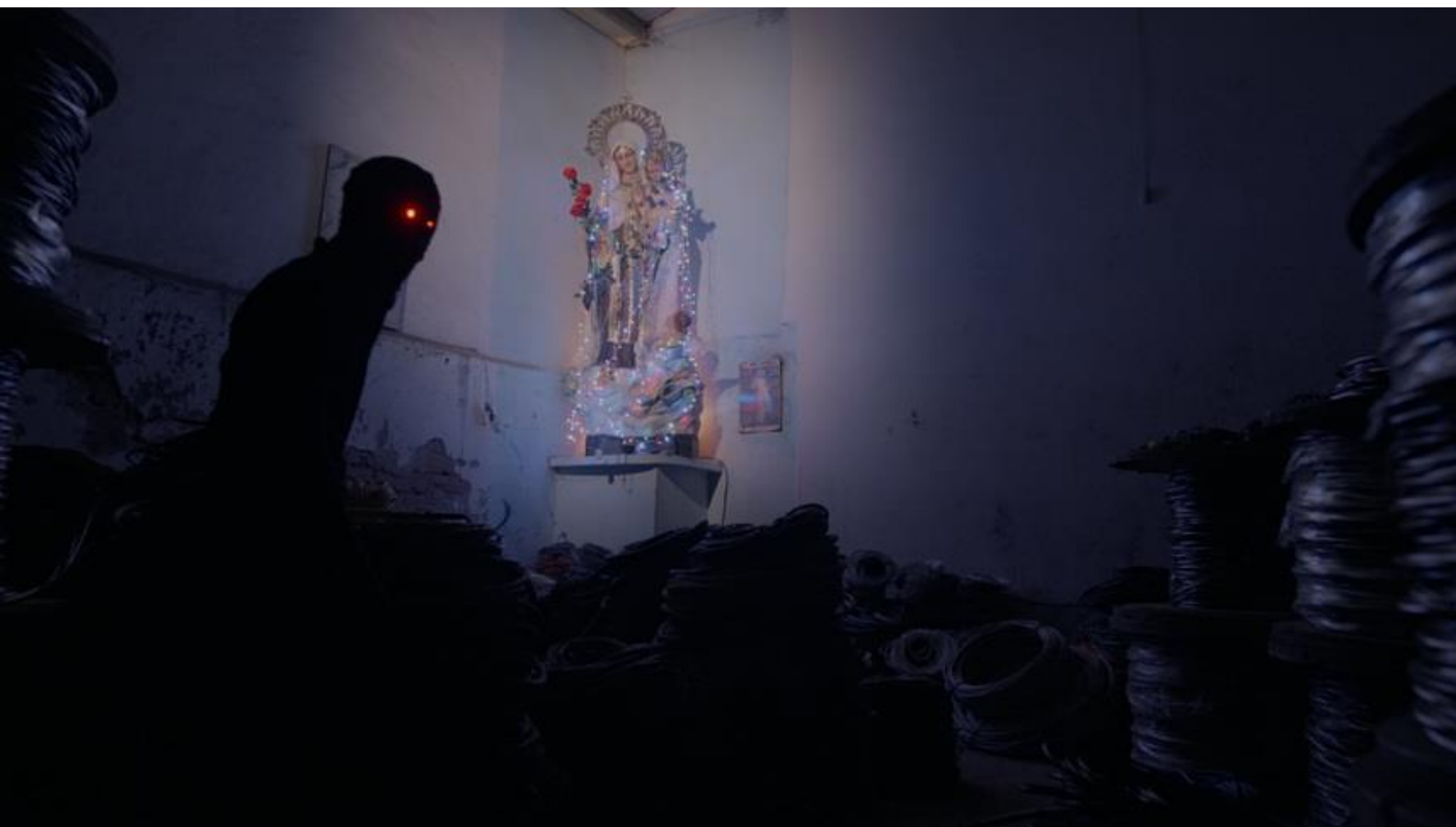
«Ángeles viviendo en un infierno de deseos»