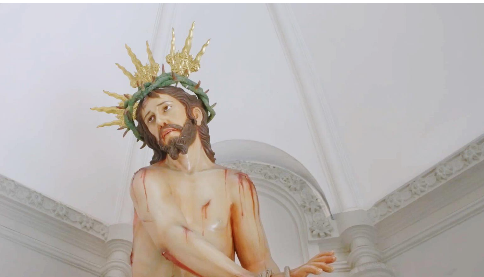
«Le confesé al Padre que me masturbaba pensando en Jesucristo»