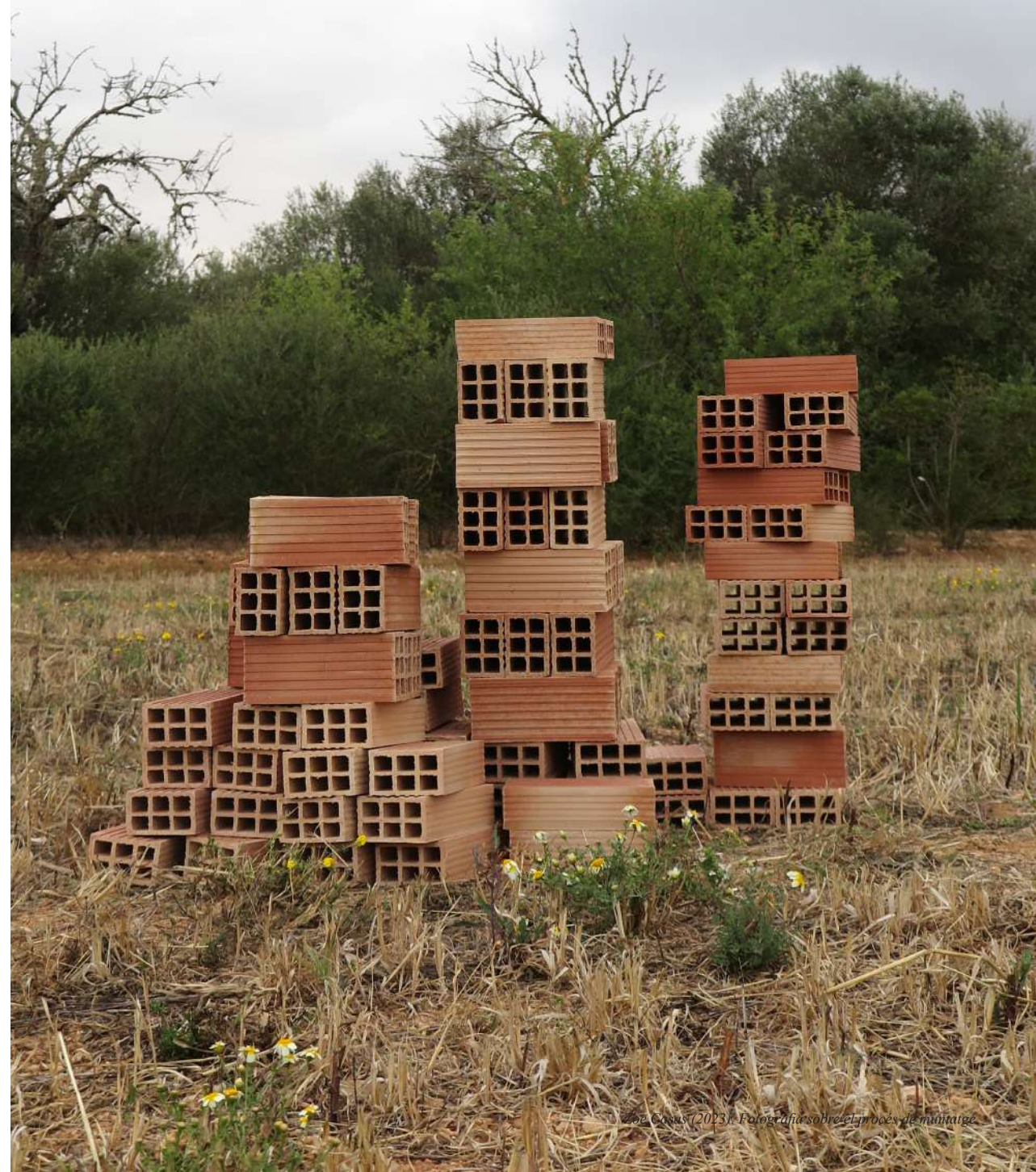
Zoe Casas (2023). Fotografia sobre el procés de muntatge.