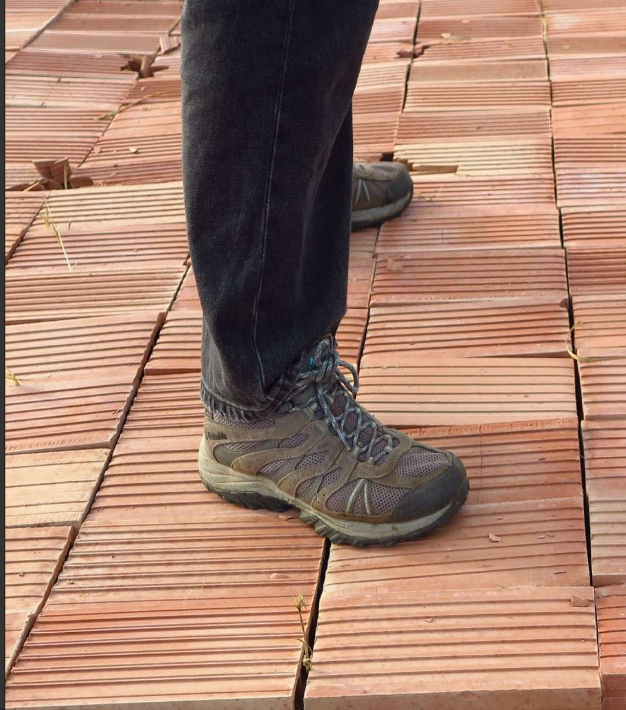
Zoe Casas (2023). Fotografia de l'obra.