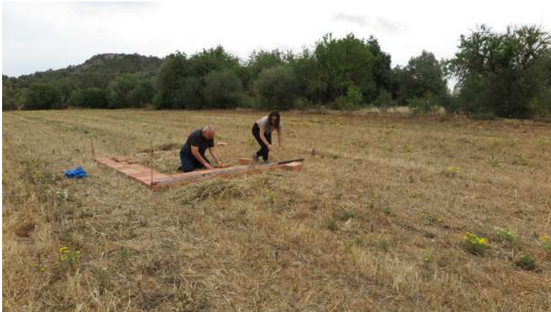
Zoe Casas (2023). Fotografia sobre el procés de muntatge.