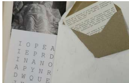
Zoe Casas (2022). Fotografia Encartar llibres.