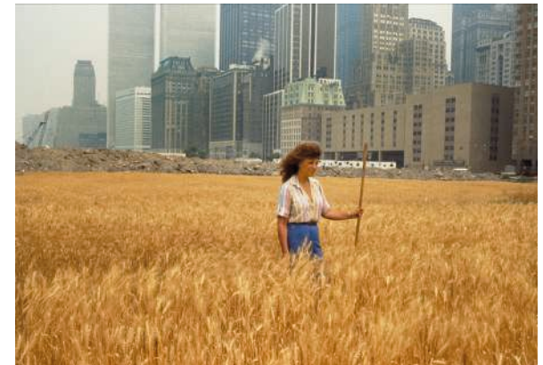
Agnes Denes. Campo de trigo- Una confrontación (1982). Fotografía de l'acció.

He escollit aquesta obra, ja que considerava que formalment poden tenir certa aparença. L'acció que fa Agnes Denes és cultivar a un sòl d'una de les grans ciutats per exposar diferents problemes com la sostenibilitat, el desastre ecològic o fins i tot problemes financers amb l'aliment. L'escenografia que ella compon, el lloc escollit i l'acció que fa és un acte de reapropiació a l'espai natural dintre d'un nucli urbà. L'acció que realitzo jo, perquè és la contrària: Genero una arquitectura enmig d'un camp de cereals ja recol·lectats. Aquesta estructura de maons em serveix per parlar de temes molt semblants que acullen dinàmiques de sistemes de poder que deixen enrere tota una cura dels espais naturals. La reapropiació de l'espai a partir del gest de sembrar és una estratègia molt suggerent i important que s'utilitza en els dos casos.