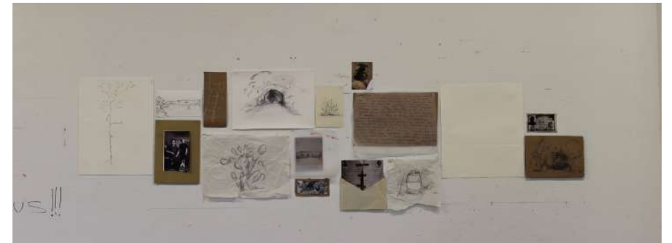
Zoe Casas (2020). Fotografia Sa Cova Monja

El projecte es centra en una investigació de Sa Cova Monja , un jaciment arqueològic de l'edat del bronze que es situa dins una finca familiar. El transcurs de la investigació desemboca en la generació d'un arxiu propi a partir de les visites diàries a la cova i la recerca d'arxiu familiar relacionat amb aquest emplaçament. Al situar-se, la cova dintre de casa, permet que la narrativa que es crea entre l'arxiu i les visites sigui molt més íntima i sigui capaç de relatar unes memòries passades. L'arxiu propi es genera a partir de diferents tècniques com el frottage , el dibuix al natural, l'escriptura automàtica, o inclús el gravat. Tot plegat crea un conjunt que declara un espai crucial per entendre la genealogia familiar.