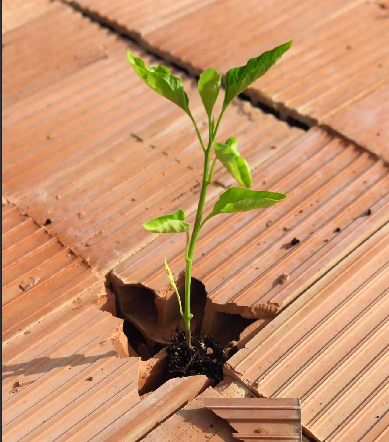
Zoe Casas (2023). Fotografia de l'obra.