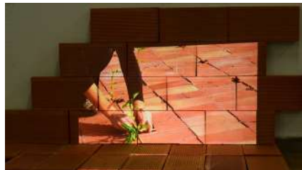
Zoe Casas (2023). Fotografia proves presentació.