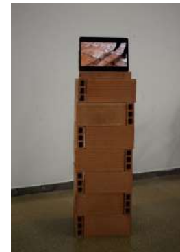
Zoe Casas (2023). Fotografia proves presentació.

La construcció d'un suport amb maons per disposar-hi el vídeo em cridava molt l'atenció, ja que confiava que seria la forma definitiva de presentar-ho. Seguint l'estructura dels mateixos maons i amb una peanya de referència vaig construir un suport on poder col·locar una pantalla. La idea em va agradar prou, la construcció era potent i et remetia a un significant nombre de qüestions. No obstant el vídeo perdia força i es presentava d'una manera molt subtil, gairebé sense pes.