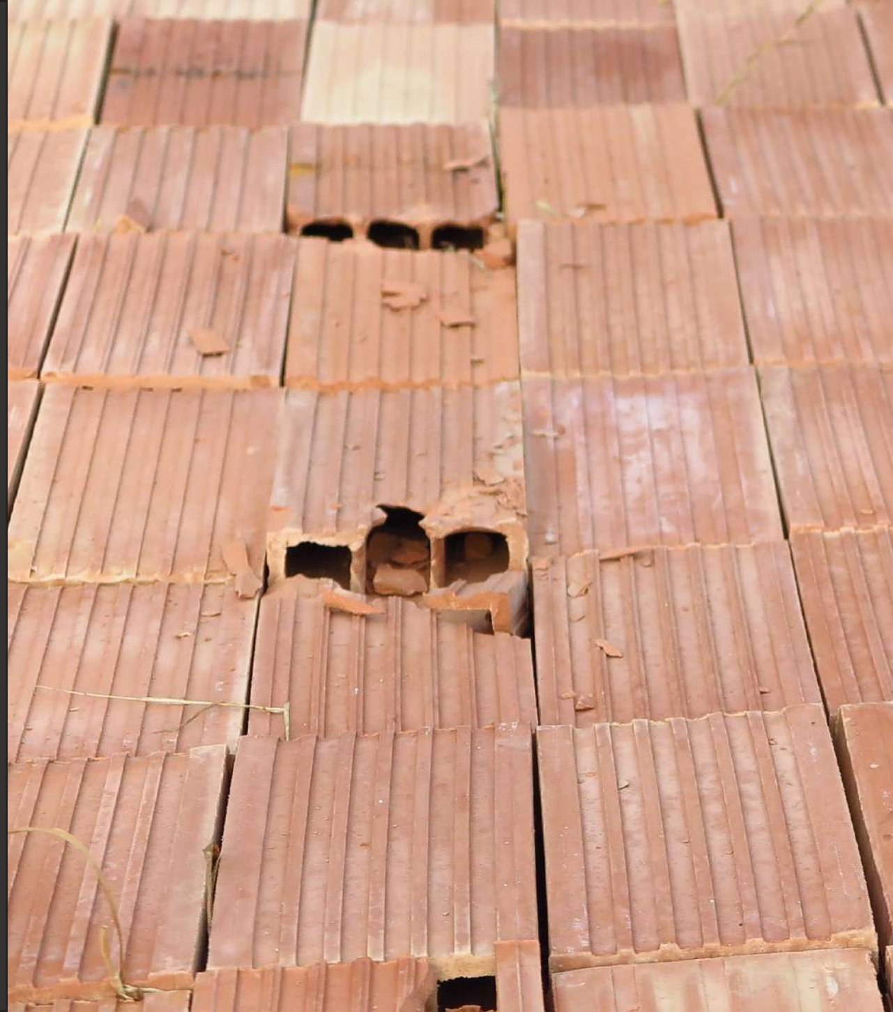
Zoe Casas (2023). Fotografia de l'obra.