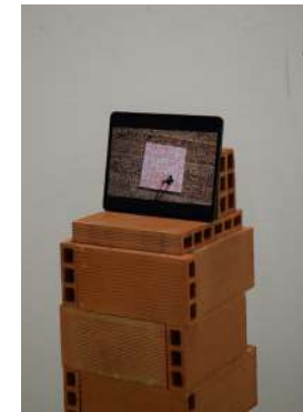
Zoe Casas (2023). Fotografia proves presentació.