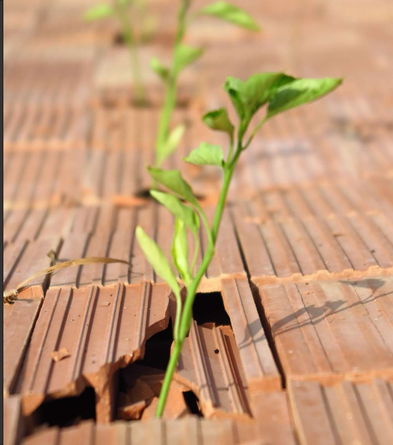
Zoe Casas (2023). Fotografia de l'obra.