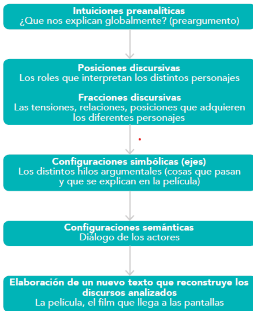
Figura 5. Símil entre els procediments de l'anàlisi sociològica del discurs i el desenvolupament d'una pel·lícula.