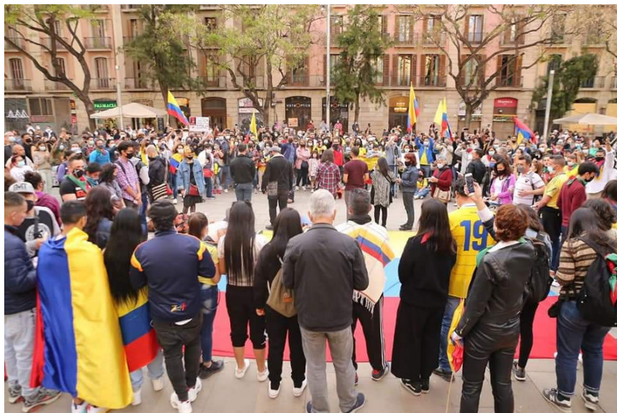
Imagen 1. Movilización en protesta 1: Colombia, Estamos Contigo. Barcelona, España, 2021