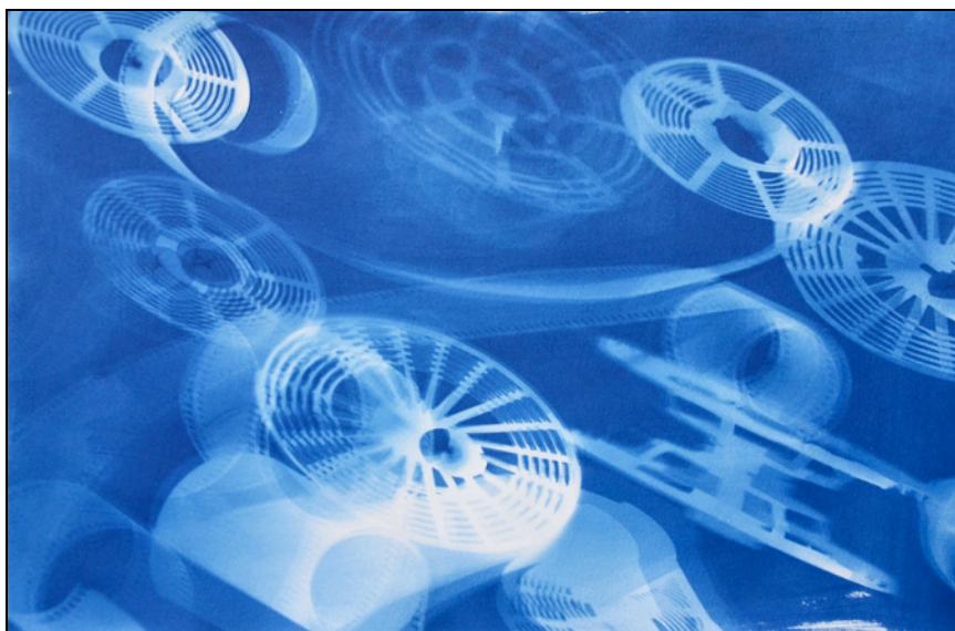
Espirals&Films (Le Grand Bleu) Aleydis Rispa 2012