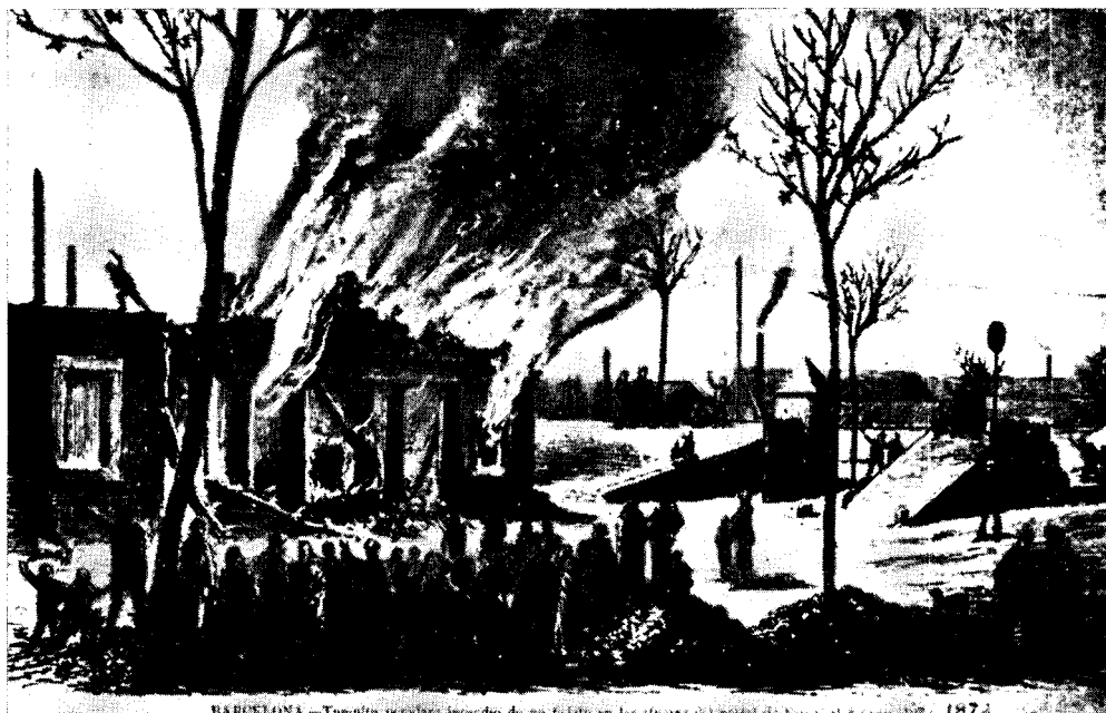
BARCELONA. — Tumulto popular: incendio de un fielato en los almacenes del puerto de San Carlos, en 1872.

Incendio de un fielato (burots) de Barcelona en un tumulto popular. Sarriá, 1872.