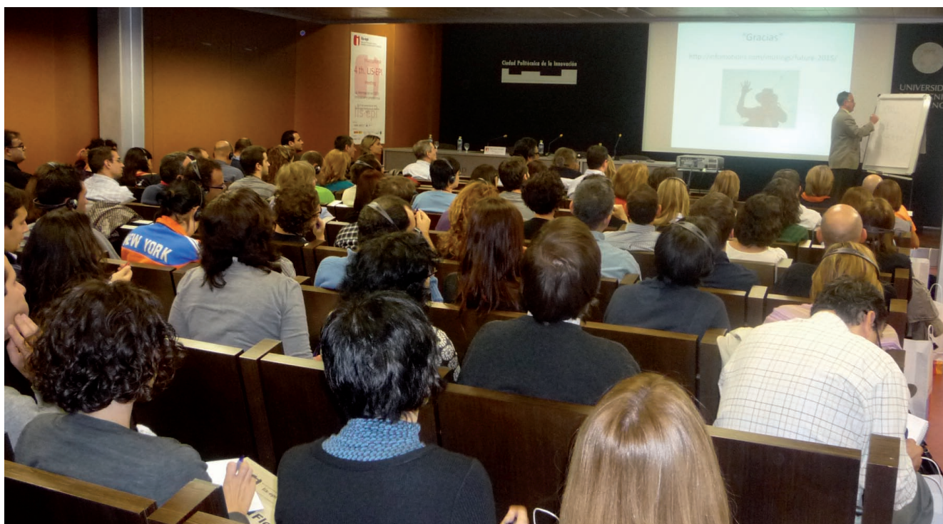
Asistentes al meeting