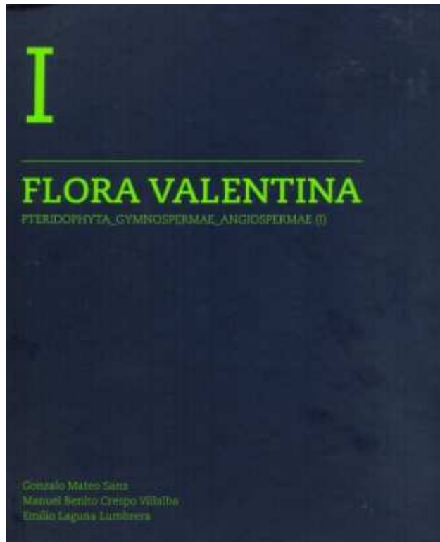
Coberta de l'edició en valencià de Flora Valentina