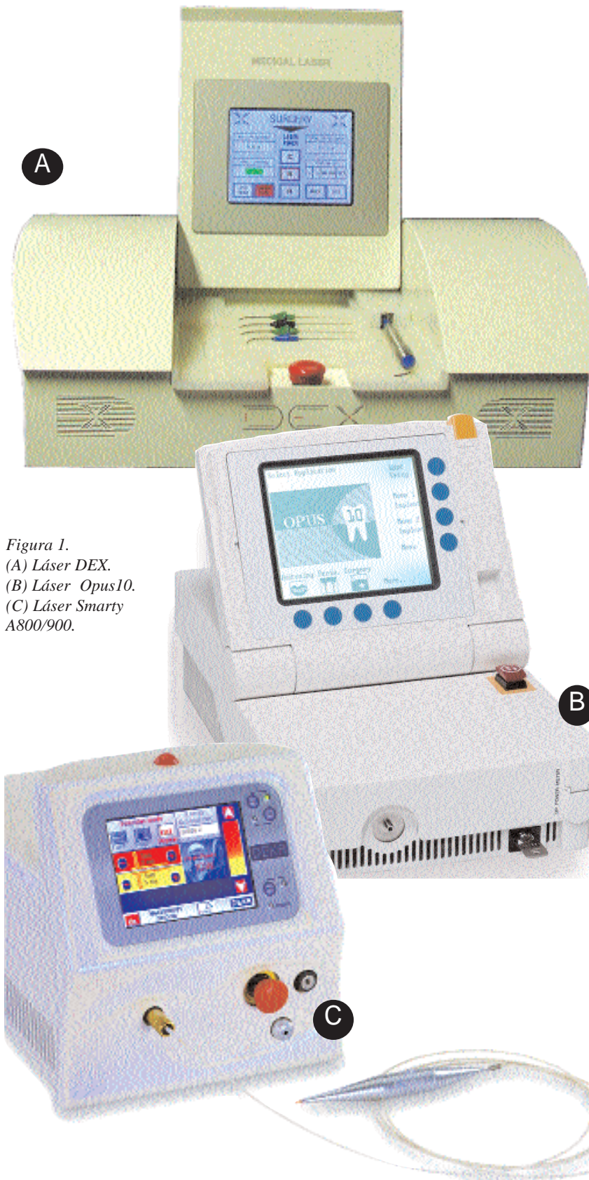
Figura 1. (A) Láser DEX. (B) Láser Opus10. (C) Láser Smarty A800/900.

El láser de diodo, debido a su pequeño tamaño y a su bajo coste económico, es actualmente uno de los láseres con más predicamento en Odontología. Las aplicaciones de este tipo de láser se relacionan con su efecto bactericida, con indicaciones específicas en Periodoncia y Endodoncia. También se utiliza en la cirugía de tejidos blandos y para el blanqueamiento dental.