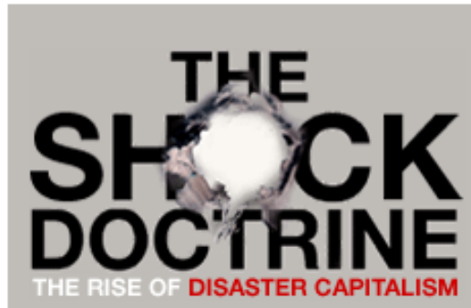
Portada de La Doctrina del shock (Naomi Klein, 2008)

El que es planteja, doncs, és si en temps de crisi, el sacrifici considerat “necessari” (per a la biodiversitat, però també per al medi en general, per al model de creixement/desenvolupament del territori en concret i del país en general, etc.) pot justificar la no-aplicació d’uns acords ja existents (i aprovats democràticament i legals) sobre el medi natural (i sobre d’altres aspectes, com ara la legislació sobre fum i tabac o l’aplicació de normes d’estrangeria o de mercat de treball). Segons com, una causa de necessitat econòmico-social (una crisi gairebé catastròfica) estaria justificant la presa de decisions que, en condicions d’estabilitat o de bonança econòmica, no es podrien prendre de cap manera, és a dir, una situació molt semblant a la “doctrina del shock ” que Naomi Klein planteja com l’exploació per part dels mercats de les situacions de catàstrofe.