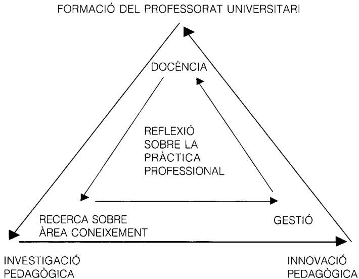
Gràfic 2: Model de DPDU (Desenvolupament Professional del Docent Universitari)

Una reflexió que, de forma individual i col·lectiva, aposti per la problematització de la pròpia tasca, pel qüestionament de la funció docent, per la sensibilització sobre els processos d'aprenentatge i d'autonomia intel·lectual de l'alumne universitari, per l'autocrítica enfront de les rutines, per l'atenció sobre el fracàs universitari, per la indagació sobre la millora dels sistemes d'avaluació, per l'exigència d'una ètica professional i per la inquietud sobre els valors i els models de vida que es transmeten.