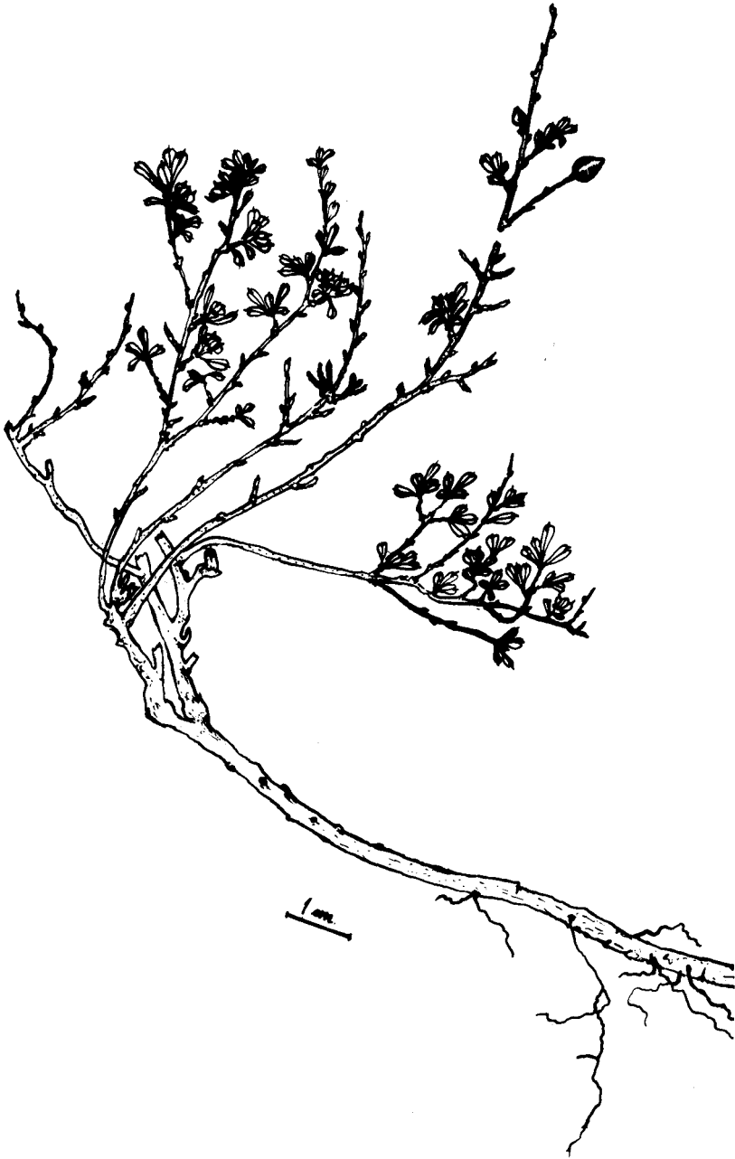
Fig. 3.— Erythroxylum perpusillum Fdez. Casas, aspecto de la planta a tamaño natural.