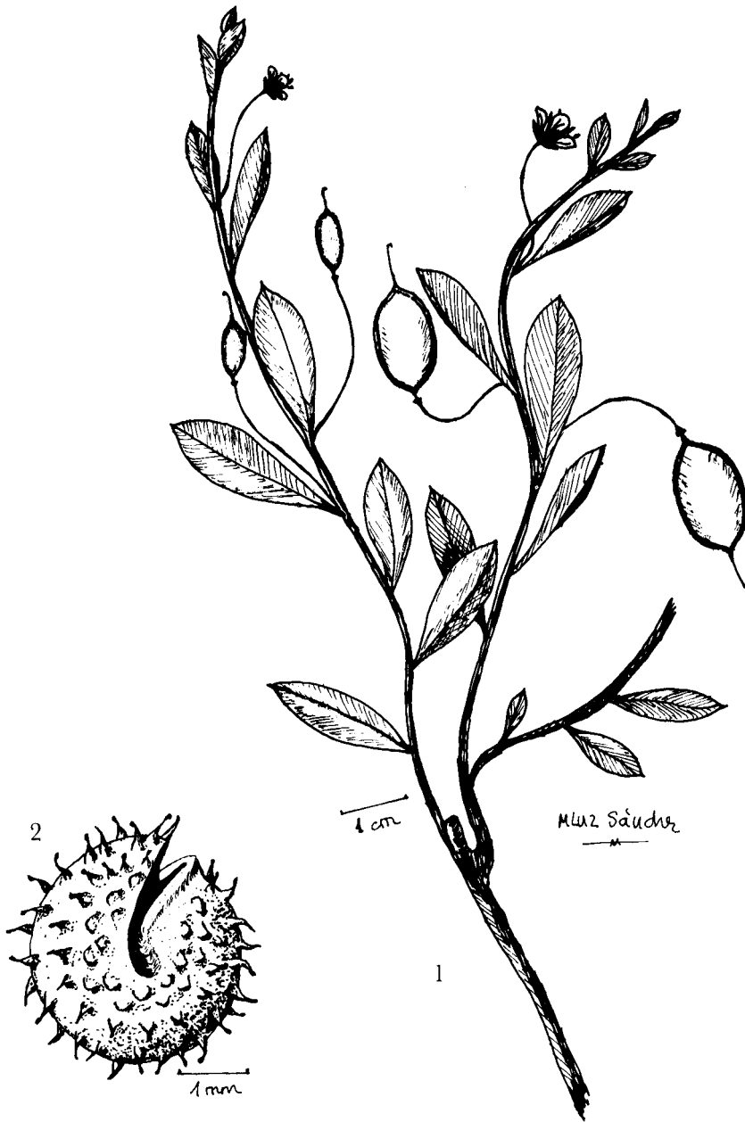
Fig. 1.— Physostemon haslerianum Chodat, 1) Aspecto de la planta a tamaño natural. 2) Semilla.