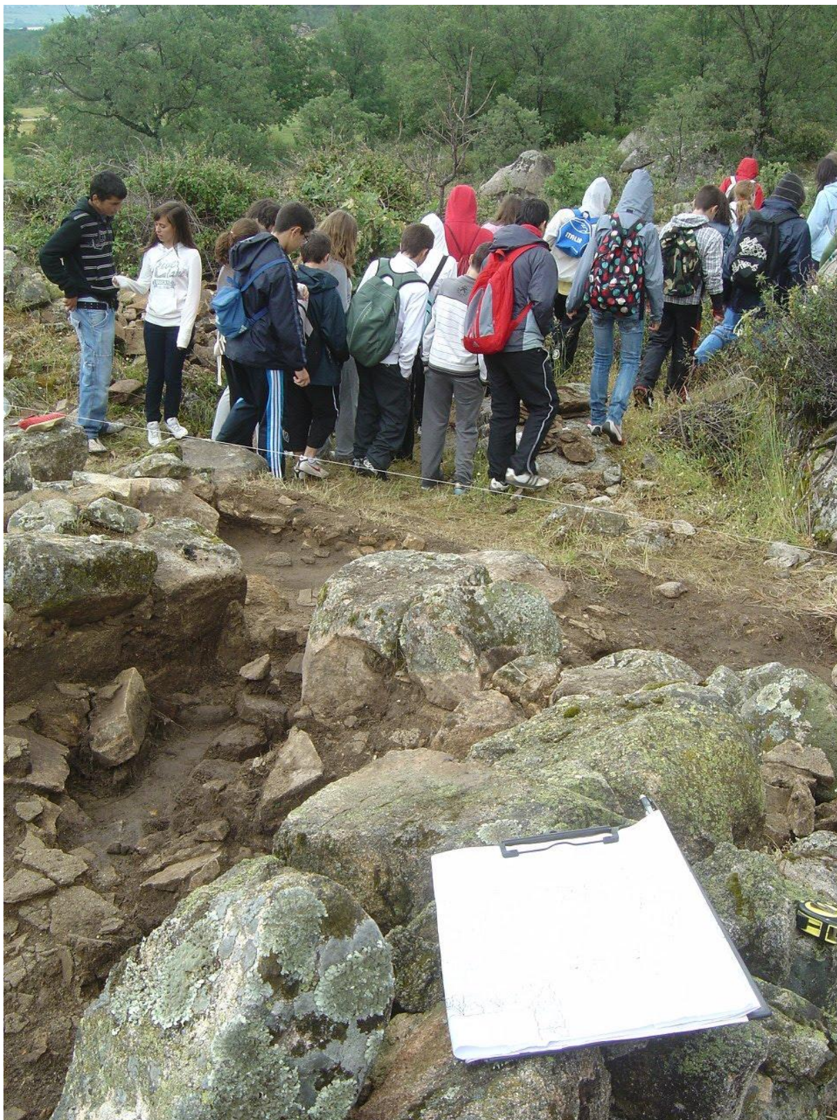
Figura 1. Estudiantes de secundaria en una visita guiada en las excavaciones de los restos del penal de trabajos forzados de Bustarviejo (1941-1957).

http://guerraenlauniversidad.blogspot.com.es/ .