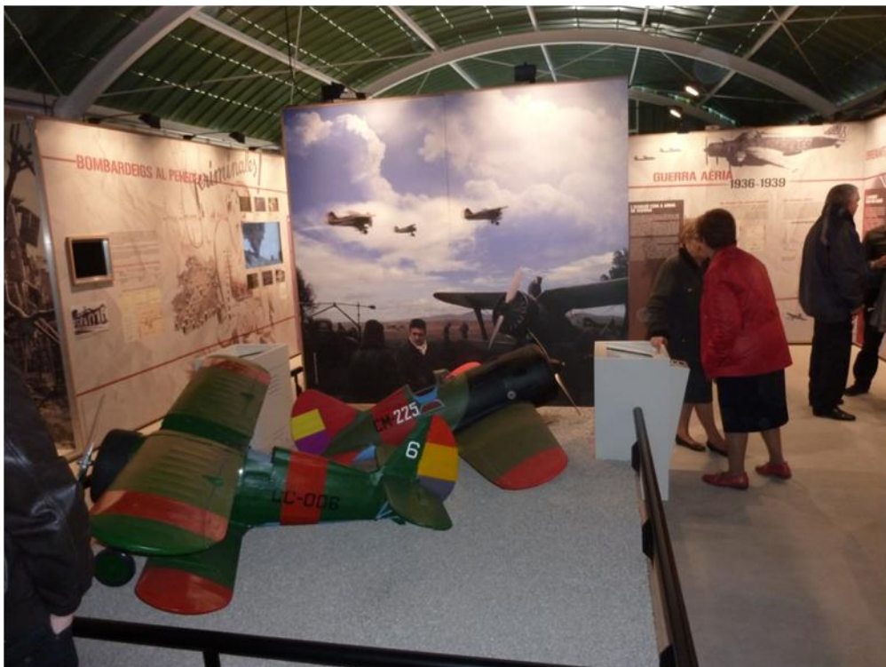
Figura 4. Museo didáctico del aeródromo republicano de Els Monjos (Barcelona).