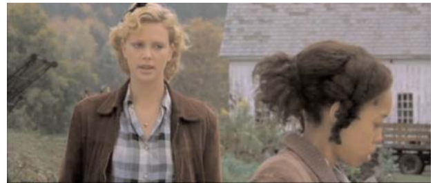
Foto 7: Candy explica a Rose su experiencia (aborto) e intenta ayudarla

de una gestación. Ante la presencia de vómitos, Homer sospecha su estado y le pregunta de cuánto está y si lo sabe, en clara alusión a su embarazo. Después de admitirlo, Rose plantea en voz alta el problema que la atormenta: ¿Qué voy a hacer con un bebé? No puedo tenerlo . Homer le pide que no haga nada ella sola y le ofrece su ayuda: Si decides no quedarte con el bebé, sé donde puedes llevarlo . Tan pronto Candy conoce el estado de Rose, le cuenta que ella también se quedó embarazada hace un año y le ofrece ayuda: Si no quieres tener el bebé, Homer te llevará a un lugar donde estarás segura... (foto 7). Cuando le pregunta sobre la paternidad del futuro bebé, la mirada de la joven (excelente ejemplo de comunicación no verbal), descubre que su embarazo es fruto de la relación incestuosa y no deseada con su padre, el Sr. Rose.