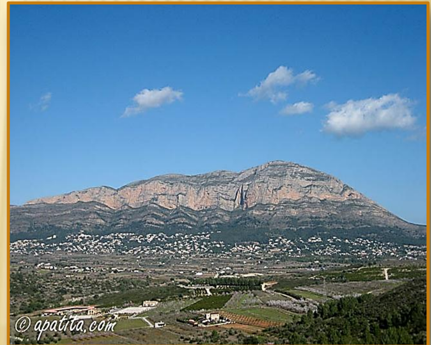
VISTA DE LA SOLANA DEL MONGÓ