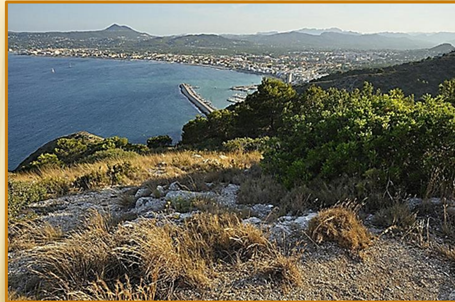
VISTA DE JÁVEA DESDE EL MIRADOR DEL FARO DEL CABO DE SAN ANTONIO