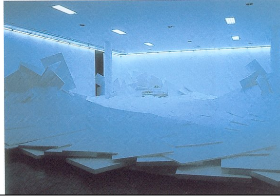
General Idea Fin de siècle , 1990

Una altra obra amb la mateixa titulació i que, des d'oposicions estètiques i conceptuals diferents, incideix en la "il·luminació" d'aquest final de segle és aquesta instal·lació poc coneguda i força extemporània de General Idea. Es tracta d'una gran instal·lació feta amb una acumulació de peces de pórex disposades desordenadament en un gran espai que, a través d'una il·luminació de barres fluorescentes, proporciona una sensació gèlida, sintètica i mancada de vida. Al fons de la sala s'hi poden observar tres focs marines fetes de materials acrílics, palla i vidre.