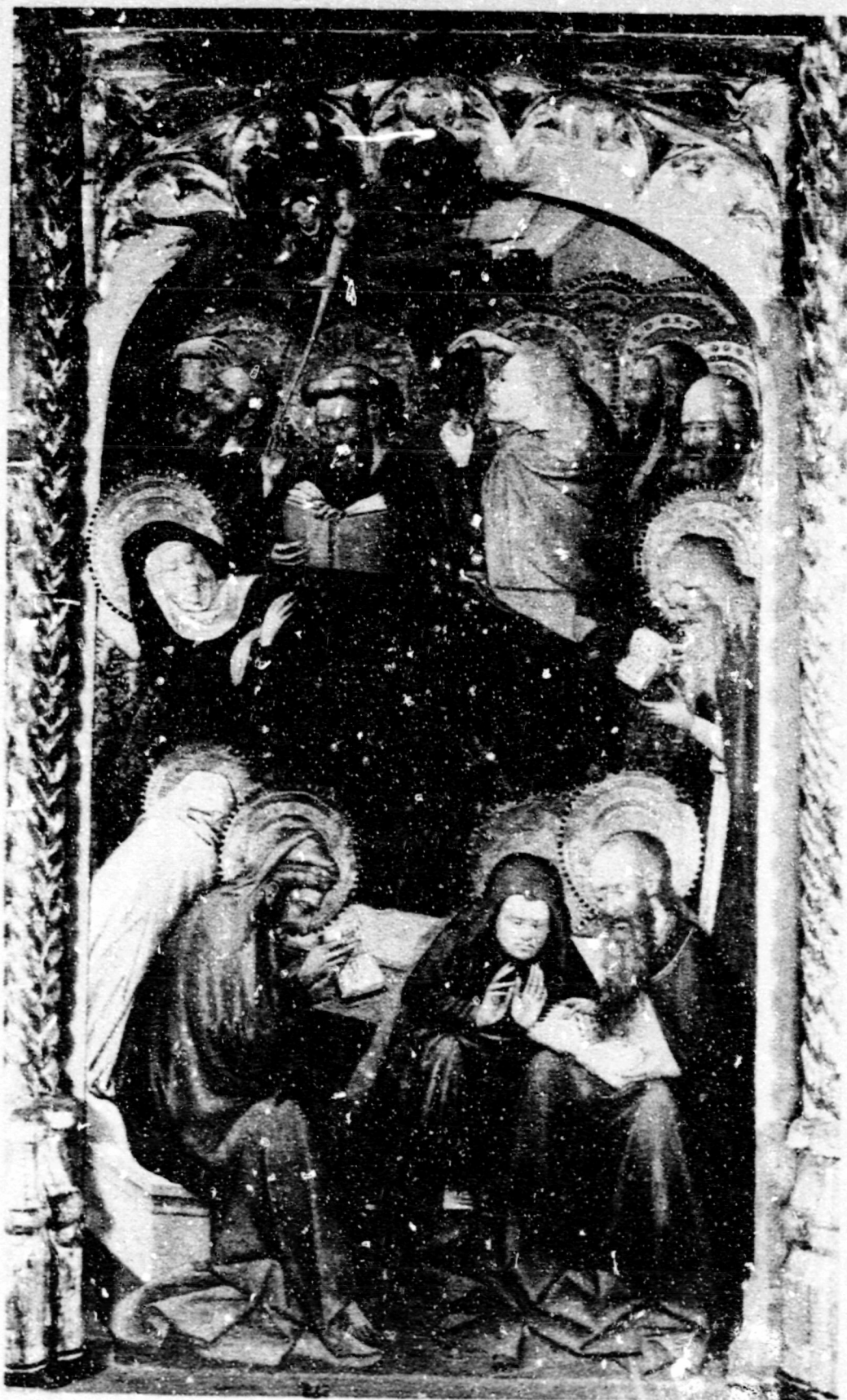
Fig. 32. Dormició. Banyoles, esg. Sant Esteve, ret. de la Verge.