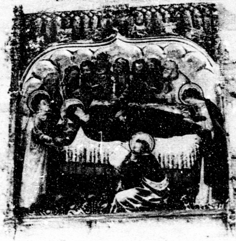
Fig.30.Dormició.Alcúdia,museu de l'esg. parroquial, taula solta.