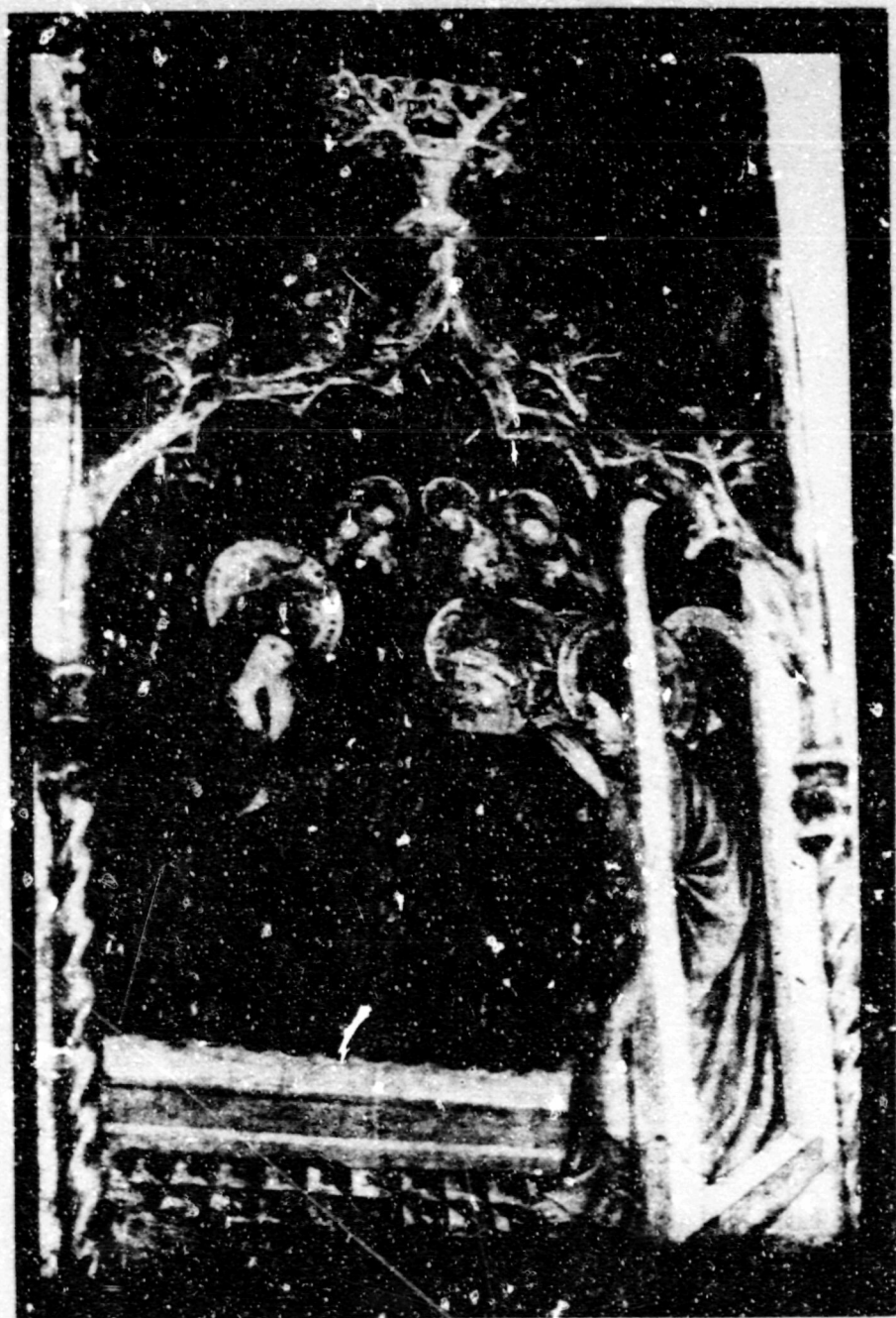
Fig.26. Coniat dels apòstols. Vilafranca del Penedès, museu, ret. de la Verge.