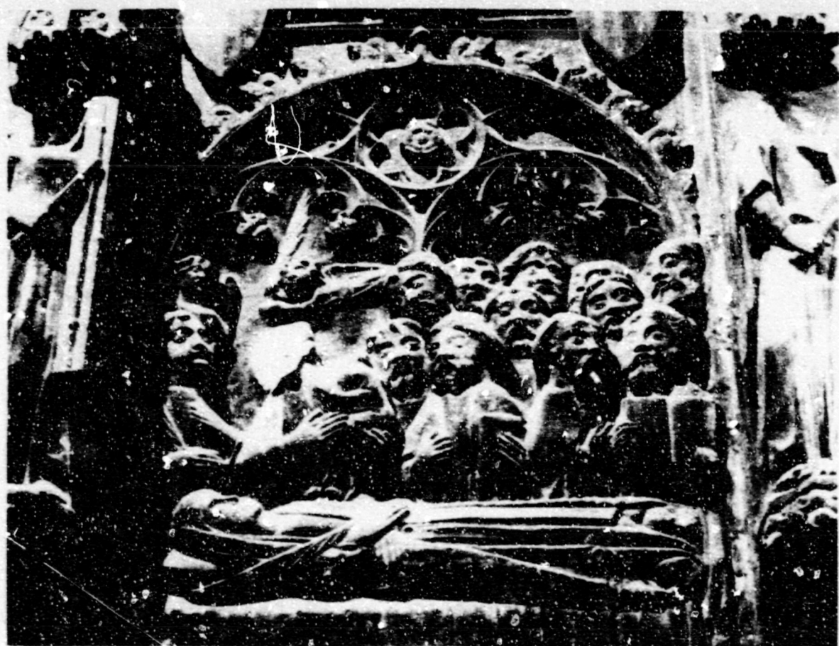
Fig.28.Dormició.Albesa, esg. parroquial, ret.de la Verge.