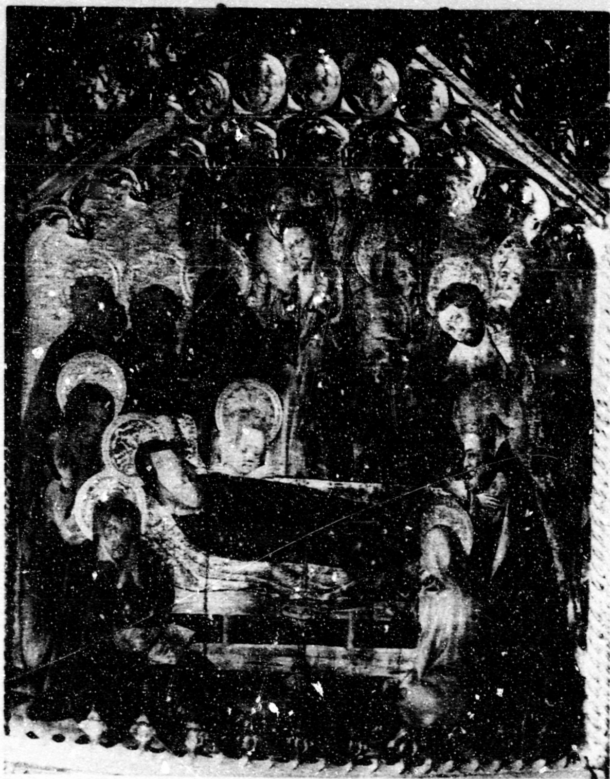
Fig.27. Dormició. Albentosa, ret. de Pere Nicolau (destruït).