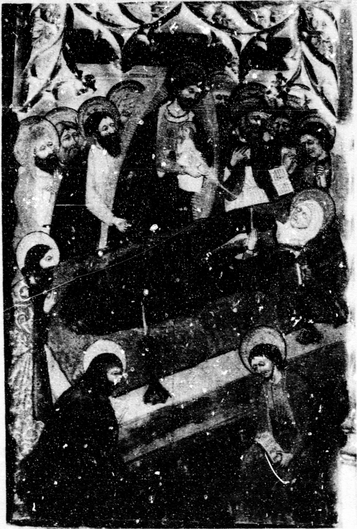
Fig.31.Dormició.All, ret. de la Verge (desaparegut).