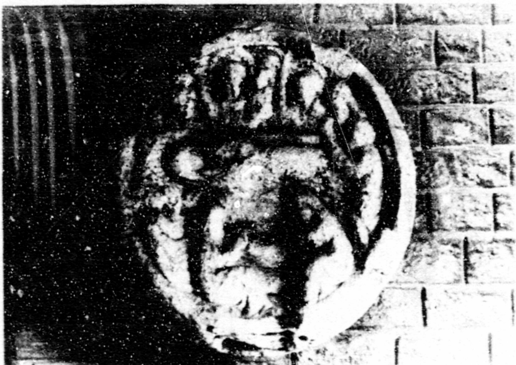
Fig.88. Dormició. Ripoll, claus_ tre, clau de volta de l'antiga coberta de creuaria del temple.