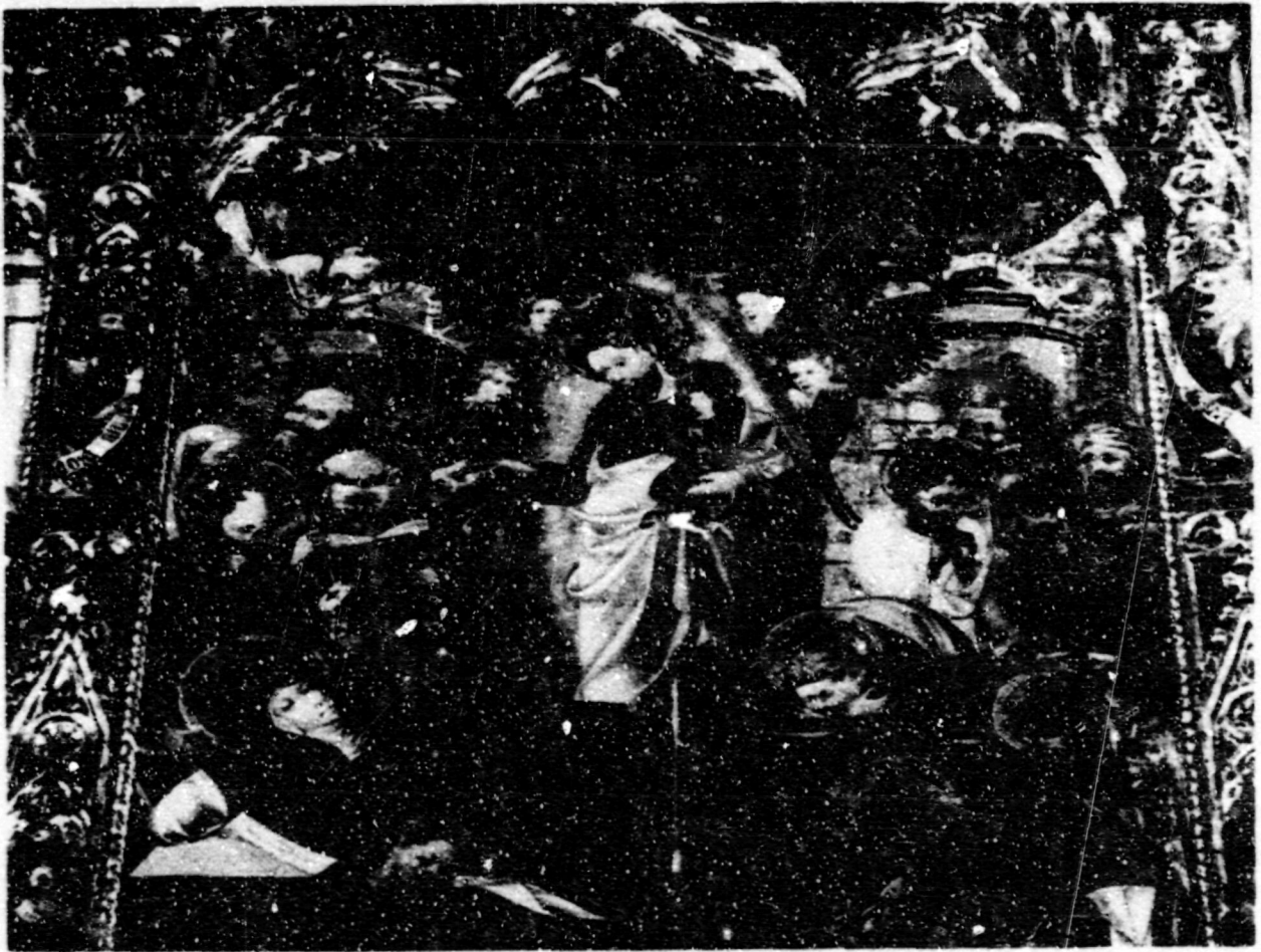
Fig.90. Dormició. Rubielos de Mora, esg. parroquial, ret. de la Vida de Crist i Maria.