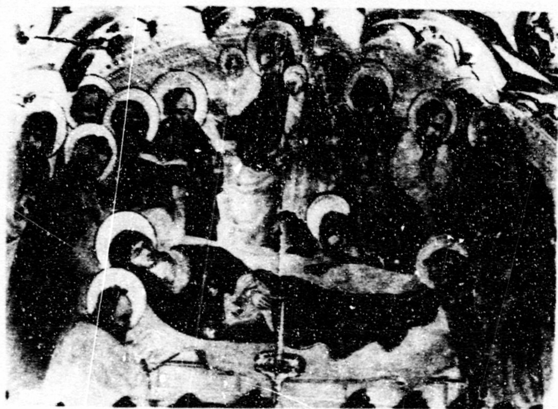
Fig.84.Dormició. Pego, esg. parro_ quial, ret. de la Verge.