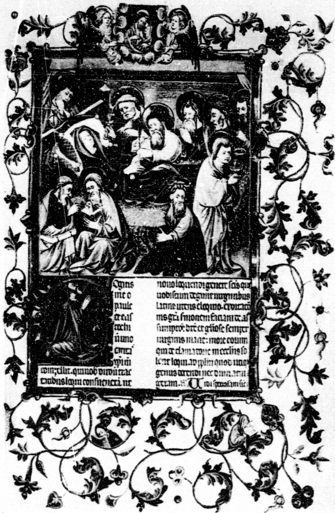
Fig. 83. Dormició. París, B. N., "Breviari del rei Martí".