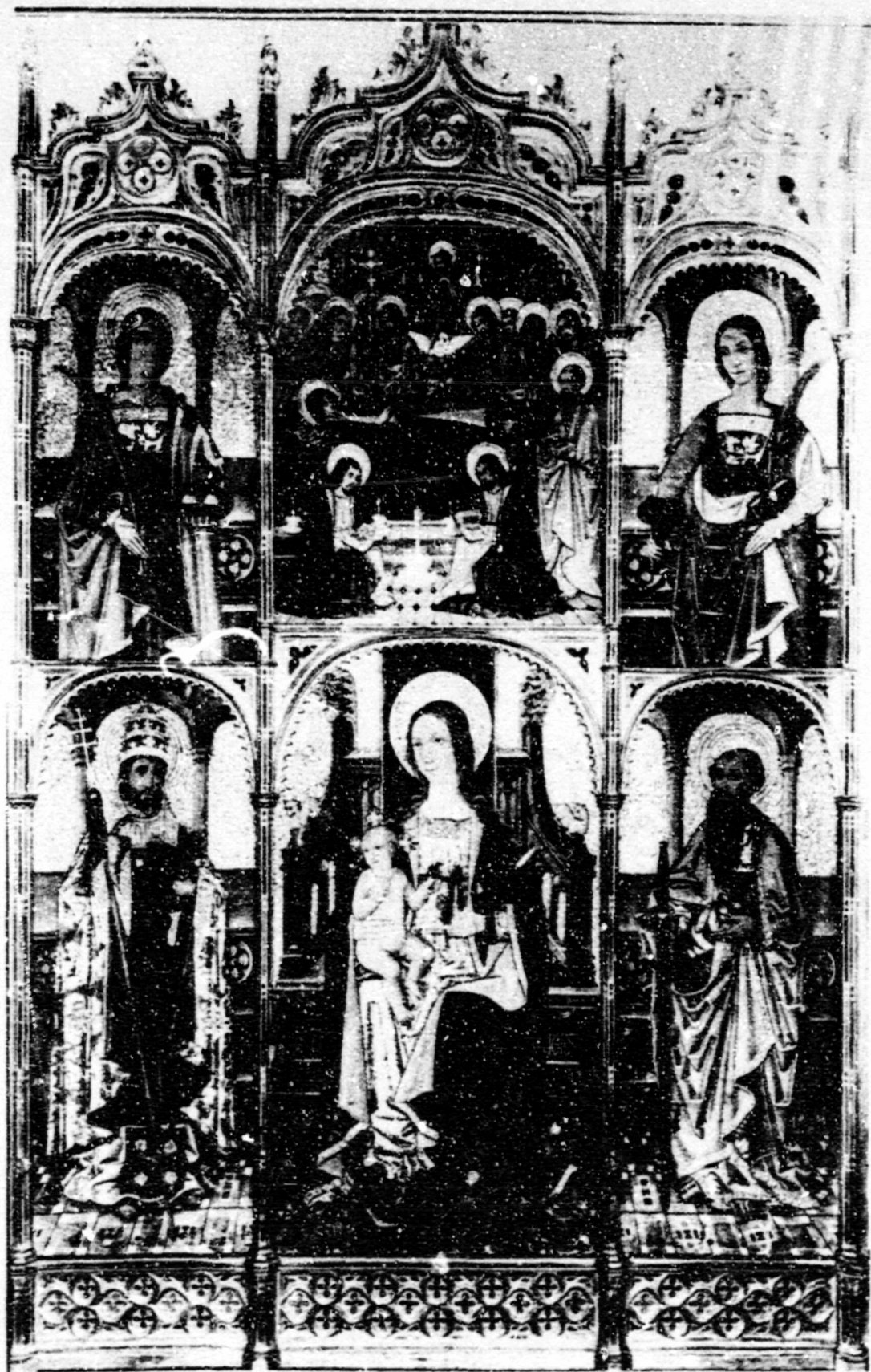
Fig. 89. Dormició. Rcma, col. priv., ret. de la Verge.