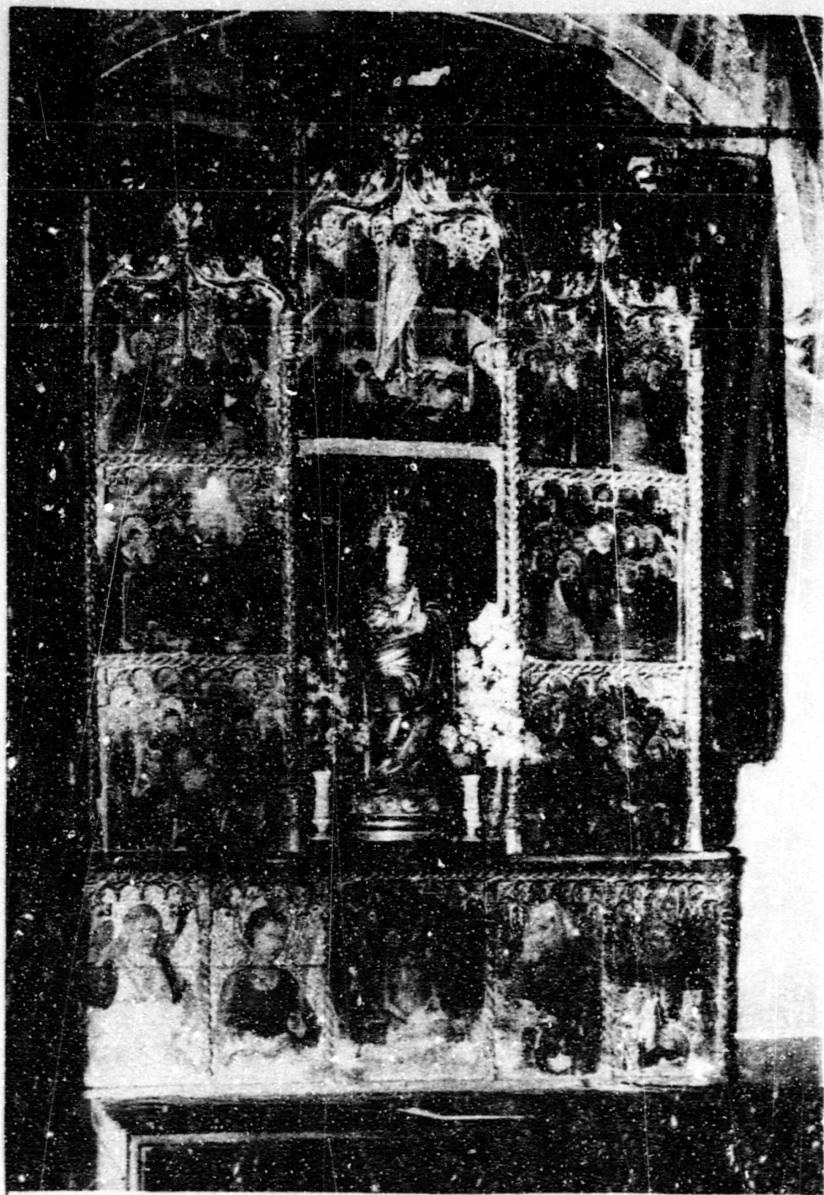
Fig.87.Dormició. Púbol, ret. de la Verge (desaparegut).