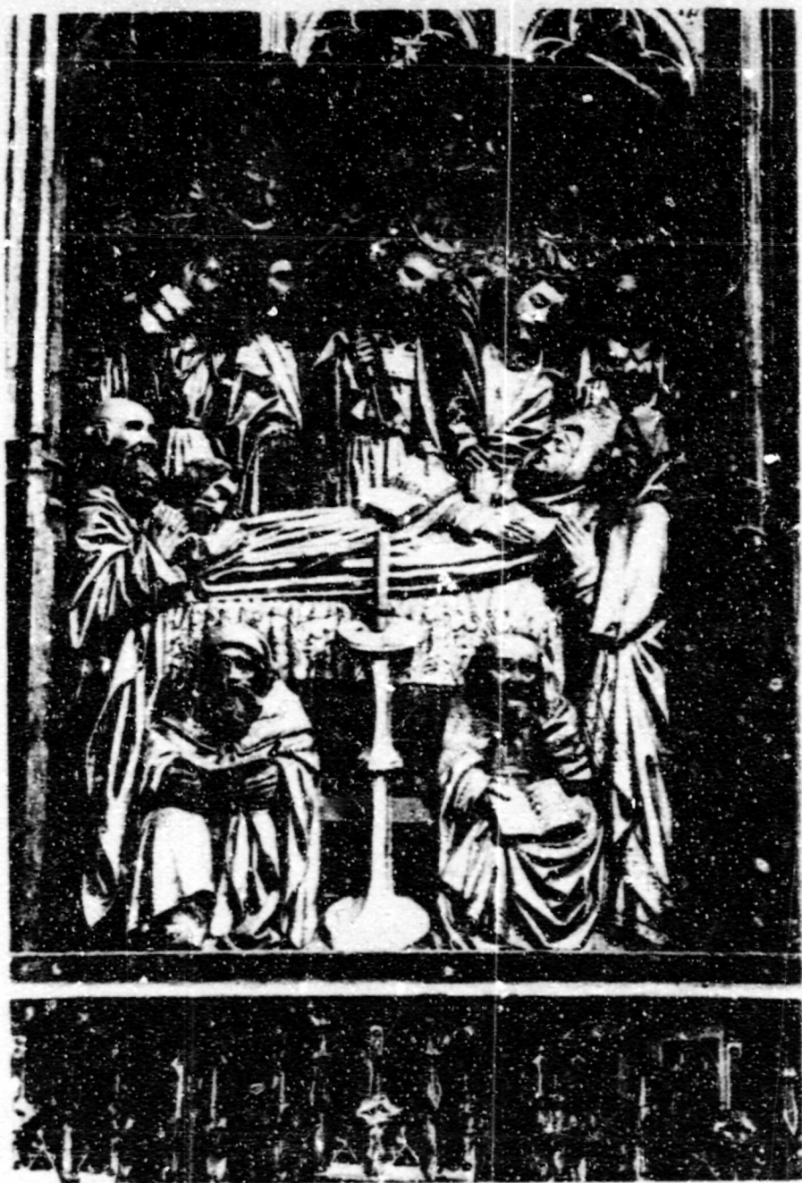
Fig.86. Dormició. Perpinyà, esg. de Sant Jaume, ret. de la Verge.