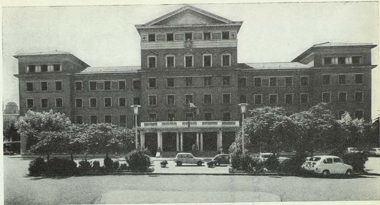
Edificio de la Facultad de Farmacia situado en la zona universitaria de Pedralbes.