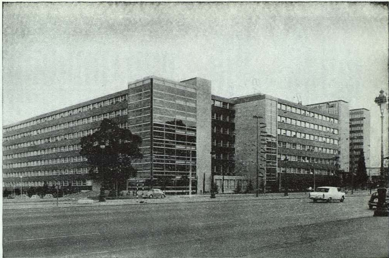
Las Secciones de Física y Química de la Facultad de Ciencias, en la zona Universitaria de Pedralbes.