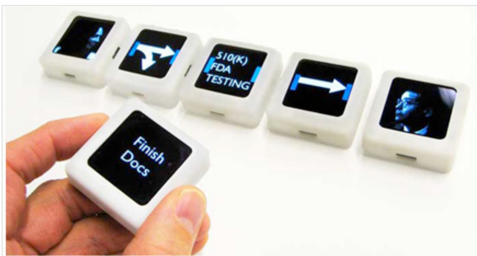
Fig. 9_6. Imatge de les Siftables.

En un intent d'apropament a la realitat més física, les interfícies són cada cop més properes, senzilles i adaptades a un públic amb més curiositat per noves tendències en àmbits d'oci i tecnologia. I aquestes aplicacions també s'obren un camí en el camp formatiu i de l'aprenentatge, i tenen noves interfícies, no sempre planes, amb noves funcionalitats, basades en esquemes diferents, en experiències diverses, que poden ser reutilitzades de manera eficaç si aprenem a conèixer-les i a ser participants del seu desenvolupament des del camp educatiu.