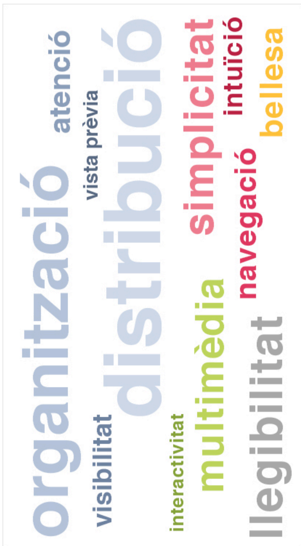
Fig. 9_4. Les percepcions del disseny web dels participants en un format de tagcloud.