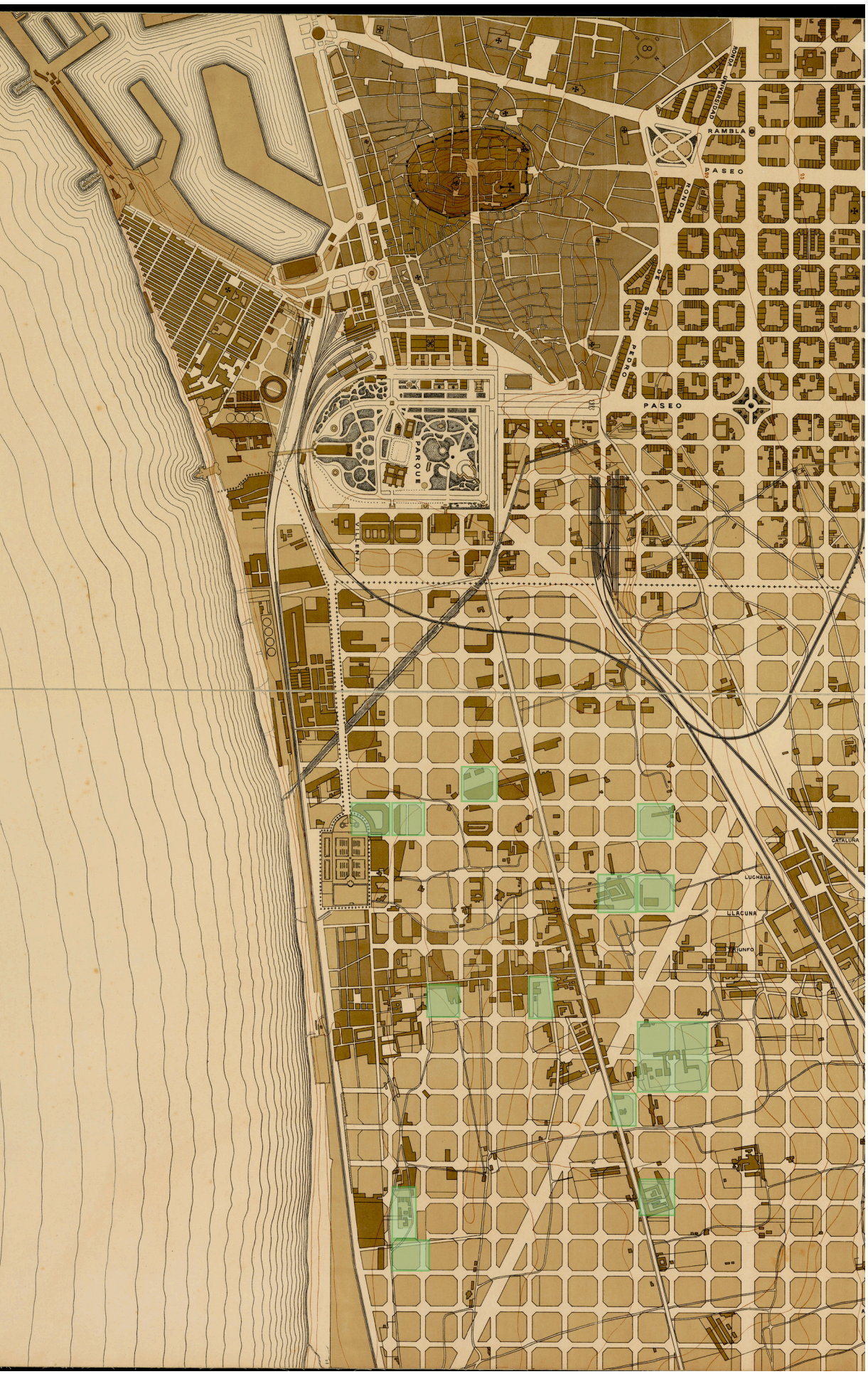
Plano de Barcelona / propiedad de su Excmo. Ayuntamiento Constitucional (fragmento), 1903. I.C.C.