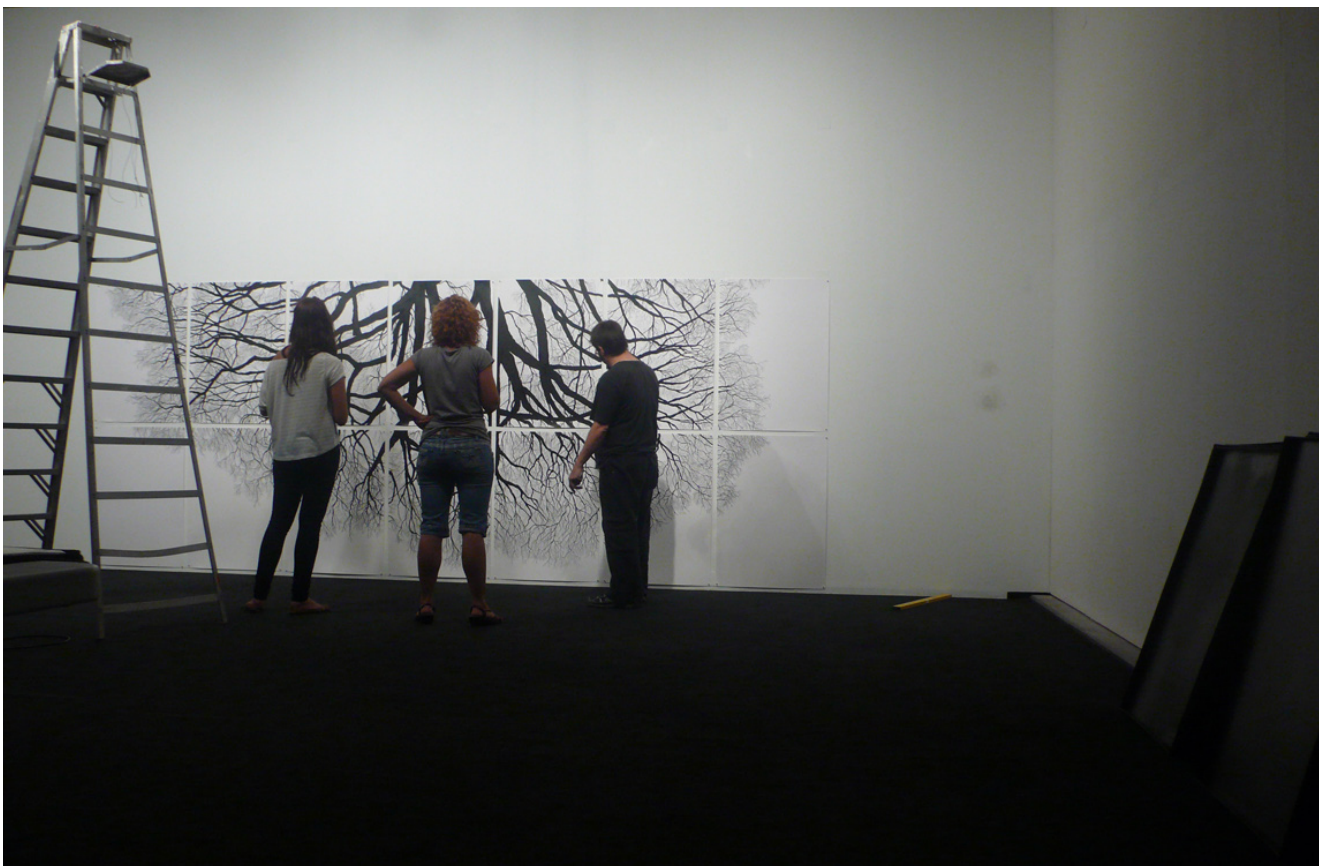
Vista del muntatge de l'exposició al Bòlit. Centre d'Art Contemporani de Girona.

- Contacte amb "agents" actius del panorama de les arts generacionalment propers als estudiants, facilitant la comunicació i la confluència d'interessos.