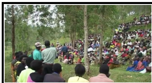
-Il·lustració 2. Fotografia d'una Gacaca-

Reportatge de Gemma Parellada: “Ruanda ¿Cómo gestionar el dolor?. Periodismo Humano, 26 Juliol 2010.