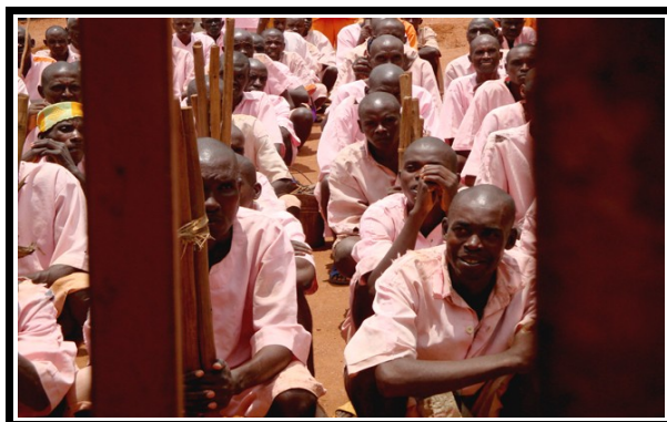
-Il·lustració 1. Pressó de Butare,2009-

Reportatge de Gemma Parellada: “Ruanda ¿Cómo gestionar el dolor?. Periodismo Humano, 26 Juliol 2010.