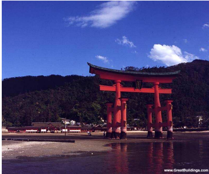
Torii Santuario de Itsukushima