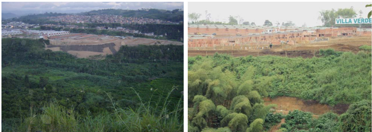
Figura 16.3. Borde urbano sur-oriental de Pereira. Procesos erosivos por urbanización y cultivo de café caturra en corredores ambientales de la cuenca del río Consota. Comuna El Poblado.

En consecuencia, las mayores proporciones de suelo perdido por erosión se han presentado en cultivos de café caturra sin sombrío y utilización de herbicidas, mientras que en los cultivos de café arábica se sigue realizando el manejo del cultivo con prácticas tradicionales (trabajo manual) y asociación del café con bosques y guaduales. Lo anterior permite afirmar la idea que en la zona de estudio han ocurrido importantes pérdidas de suelo por erosión, al menos en aquellas unidades en donde se han implantado caturrales.