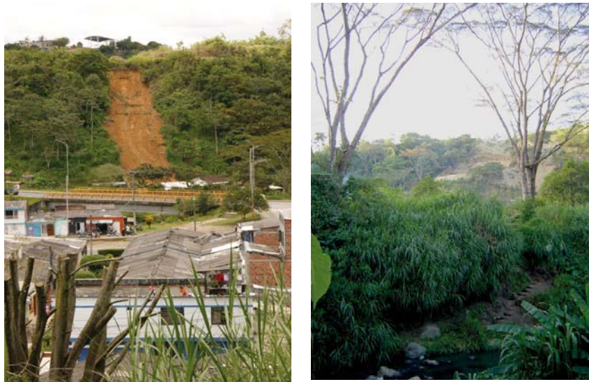
Figura 16.4. Pereira. Procesos erosivos. Ladera empinada cuenca valle en “V” río Consota.

En la siguiente figura se muestra la ocurrencia de deslizamientos por la tala de la cobertura natural, la construcción de vías y la explotación clandestina de pequeñas canteras. De igual forma, se presenta en algunos asentamientos humanos la inadecuada o nula canalización de aguas lluvias y aguas negras (caso: La Platanera) que coadyuvan a la erosión laminar; este fenómeno manifiesta la falta de acompañamiento y prestación de los servicios públicos y las infraestructuras de saneamiento básico (Aguas y Aguas de Pereira, etc.) a la población desplazada que va conformando nuevos asentamientos humanos; no obstante, sí se les ha instalado contadores de energía, acueducto, con el propósito de “evitar pérdidas y legalizarles estos servicios que antes eran piratas”.