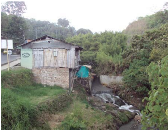
Figura 16.8. Pereira. Comuna El Poblado. Contaminación hídrica del río Consota.

En este sentido se insiste que, dejando de lado “el espectro del mundo aparente”, se descubren los verdaderos procesos, elementos y actores que promueven y son la base de la transformación y degradación ambiental del área periférica y de expansión urbana. Así, la relación explicitada anteriormente, entre partidos políticos - actuaciones administrativas públicas - mercado inmobiliario y organizaciones de vivienda en la escala local y – tenencia de la tierra - conflicto armado - crisis agraria (cafetera)-desplazamiento- en el contexto regional y nacional, ha ocasionado la territorialización de tantos barrios en áreas de difícil habitabilidad y cobertura de servicios, proclives a verse afectados por fenómenos naturales (crecidas de río e inundaciones, terremotos, etc.), a generar fragmentación de coberturas arbóreas y ecosistemas, como también a producir la contaminación de los drenajes y ríos (baja cobertura en el servicio de alcantarillado, siendo inadecuado el sistema de evacuación de las aguas residuales).