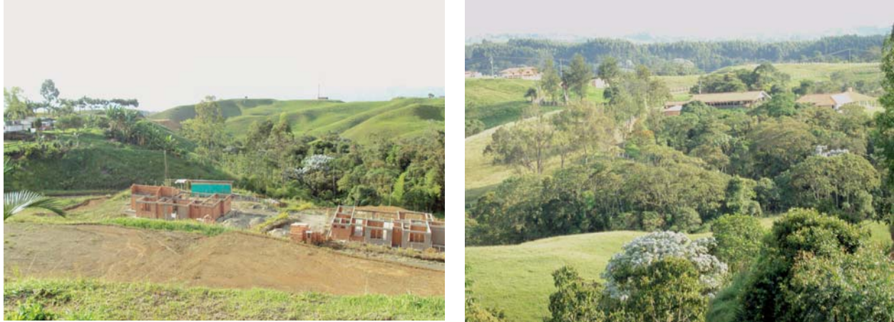
Figura 16.6. Pereira. Zona de expansión sur-oriental. Parcelación Condina. Transformación del paisaje por fragmentación de coberturas arbóreas (Construcción de condominios neorrurales y ampliación de la potrerización para establecimiento de ganado).