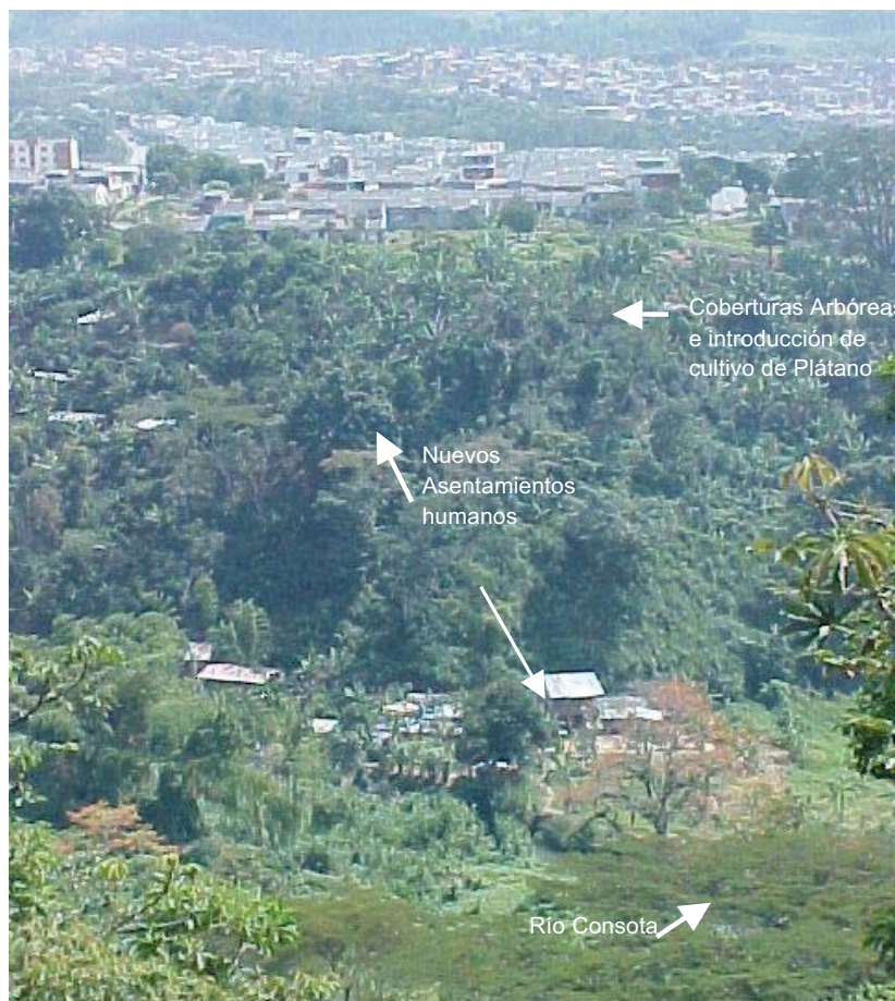
Figura 16.2. Vista del valle aluvial y laderas del río Consota. Territorialización de barrios populares.

De igual manera se presentan paisajes y subpaisajes del Gran Paisaje de los Valles estrechos intramontanos coluvio-aluviales . El paisaje Terrazas coluvio-aluviales ocasionalmente inundables se ha originado por la depositación de materiales de deslizamientos y desplomes procedentes de la laderas adyacentes, su relieve varía de plano a inclinado, siendo las unidades planas las más susceptibles a inundaciones ocasionales. En la siguiente figura se muestra como se están ocupando estas áreas de las terrazas coluvio-aluviales por asentamientos humanos, en su mayoría por población desplazada, junto a barrios de interés social.