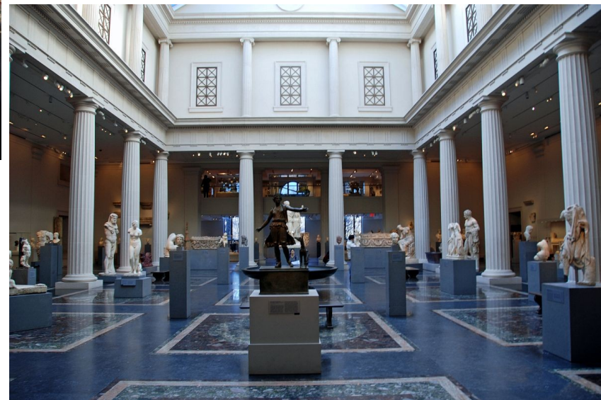
Metropolitan Museum of Art (MET), Nova York. Inauguració: 1872