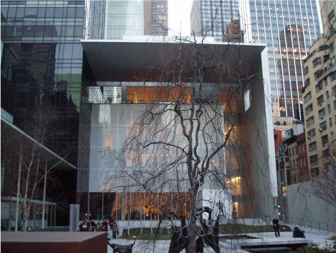
Museum of Modern Art – MoMA, Nova York (1938-39 Philip Goodwin & Edward Stone Architects) (2004 Ampliació: Yoshio Taniguchi & Associates; Executive Architect: KPF)